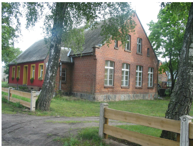
Świetlica wiejska w Klaskawie

Na obrzeżach wsi, już za torami kolejowymi, na skraju szkółki leśnej, można znaleźć bezimienny grób, w którym podobno pochowano żołnierza francuskiego z czasów I wojny światowej. Kiedyś grób umiejscowiony był obok budynku obecnej świetlicy wiejskiej. Został on przeniesiony tuż po zakończeniu działań wojennych na tym terenie, w spokojniejsze miejsce, z dala od szkoły podstawowej.