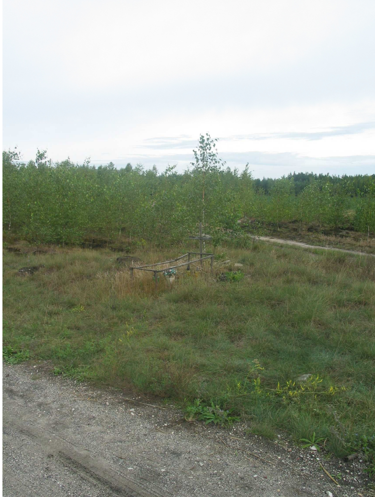
Grób francuskiego żołnierza w Klaskawie