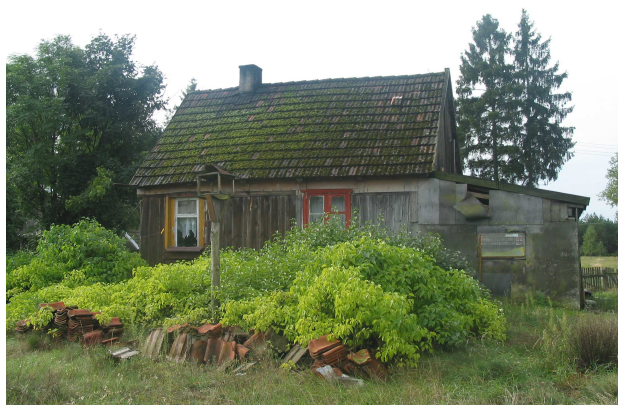
Dom Klaskawa 35