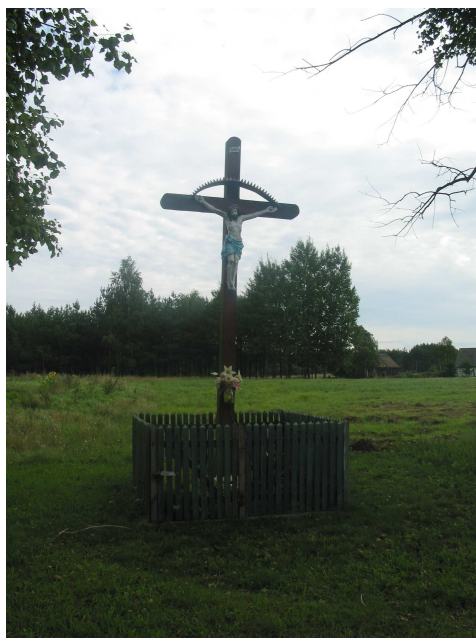
Krzyż w Klaskawie