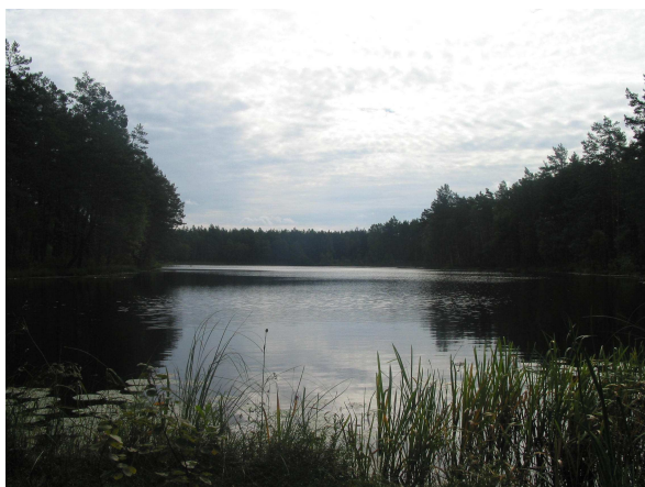
Jezioro Mała Lontka