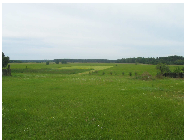
Łąki Klaskawy 1