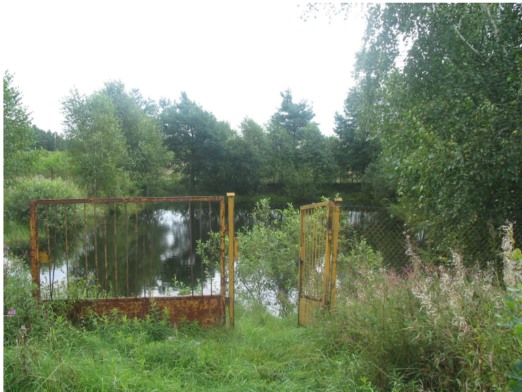
Staw w Klaskawie