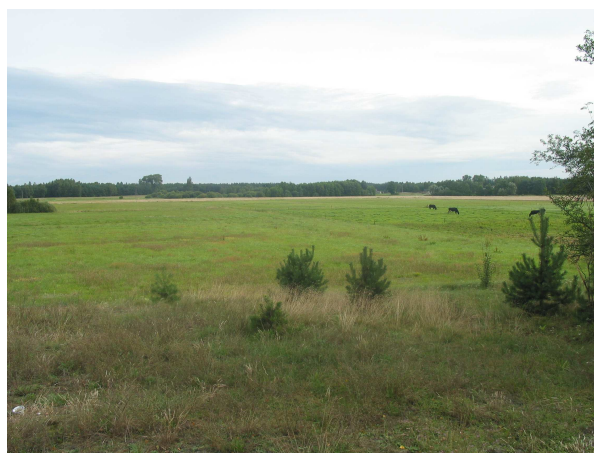
Łąki Klaskawy 2