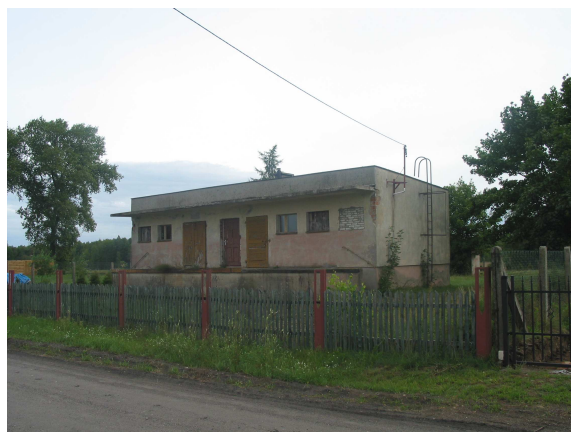
Budynek dawnej zlewni mleka w Klaskawie