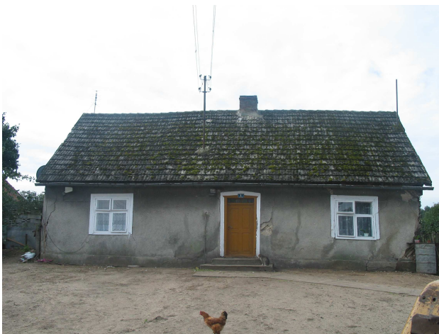
Dom Klaskawa 1, w którym mieściła się pierwsza szkoła

Na przestrzeni lat większość starszych domów na terenie wsi została rozebrana lub po przebudowie straciły swój oryginalny charakter. Pozostały tylko nieliczne z nich, między innymi domy kryjące się pod adresami Klaskawa 1, 5 i 35.