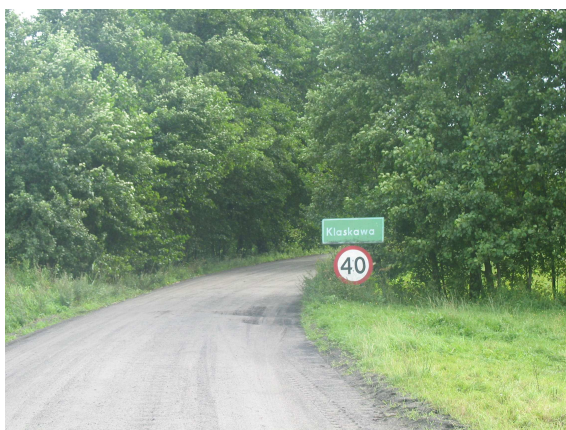
Wjazd do wsi od strony Będźmierowic