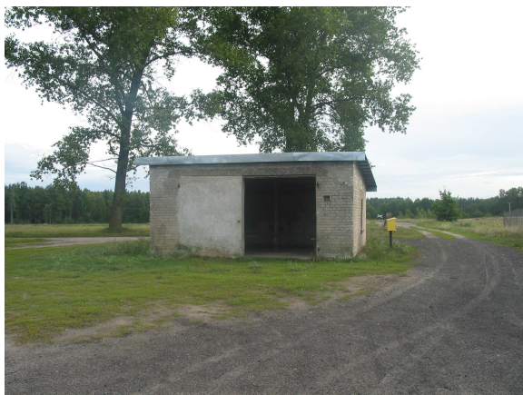
Przystanek autobusu szkolnego w Klaskawie

Miejscowa świetlica, która zajmuje część budynku po dawnej szkole podstawowej, jest jedynym, miejscem użyteczności publicznej w Klaskawie. Wynika to z faktu, iż wieś położona jest w bliskiej odległości od Czerska, w którym mieszkańcy mają dostęp do urzędów, banków, ośrodków zdrowia, a także do kościoła. Klaskawa przynależy do parafii p.w. Św. Marii Magdaleny w Czersku.