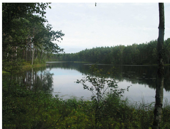
Jezioro Duża Lontka