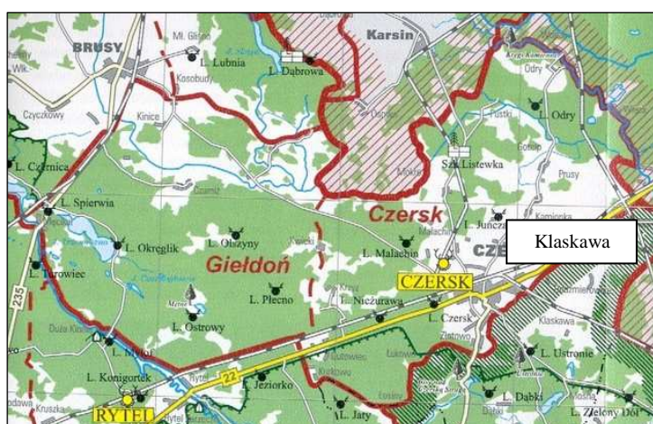
Sołectwo Klaskawa na tle podziału administracyjnego lasów

Bogactwem wsi Klaskawa są łąki i lasy. Łąki, stanowiące obecnie pastwiska, niegdyś były obfitym źródłem torfu, które nie zostało jeszcze wyczerpane. Lasy dostarczają głównie drewna opałowego oraz różnorodnego runa leśnego. Tereny od wielu lat były terenami podmokłymi, z uwagi na obecność przepływającej Klaskawskiej Strugi oraz jezior Mała i Duża Lontka oraz Trzebomierz.