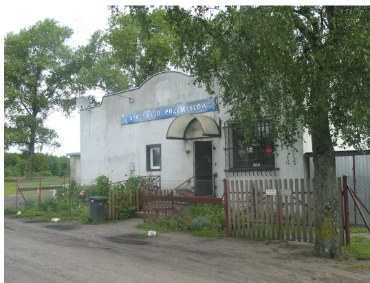
Sklep spożywczy w Klaskawie