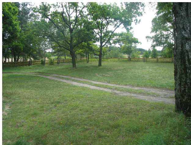
Teren przyległy do świetlicy