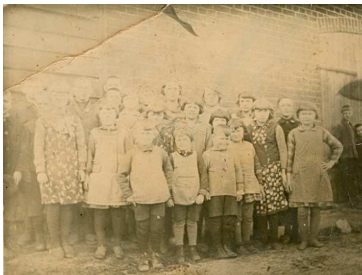
Zdjęcie dzieci przed szkołą, 1937 r.