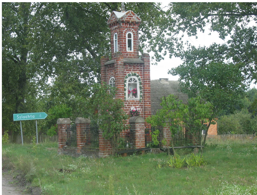
Kapliczka w Klaskawie