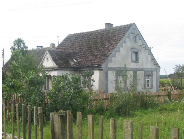
Dom Klaskawa 5