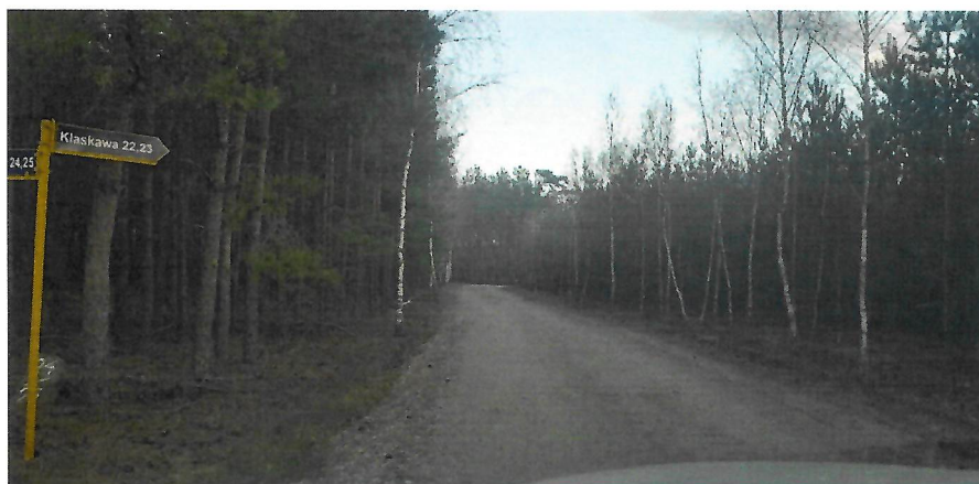
Foto nr 2. Rozwidlenie drogi – odcinek drogi do jednego gospodarstwa rolnego i jednej nieruchomości letniskowej.

Nie dość tego do zaprojektowania (jeszcze do niedawna drogi wewnętrznej) „ślepej” drogi w środku lasu wykorzystuje Pan obecnie tzw. „spec ustawę drogową” z 2003 r. i wnioskuje Pan o wydanie decyzji zezwalającej na realizację inwestycji drogowej a nie zwykłej decyzji o pozwoleniu na budowę. Przypomnę tylko, że spec ustawa drogowa powstała w 2003 r. i miała pomóc Polsce w realizacji budowy m.in. dróg expressowych i autostrad na EURO 2012. Z czasem ustawę zmieniono i wprowadzono do niej drogi wojewódzkie, powiatowe i gminne. W ten sposób ułatwiono samorządom możliwość przejmowania nieruchomości przez samorzady pod drogi za odpowiednim odszkodowaniem. Zapewne ustawodawca wprowadzając tego typu zapisy w ustawie nie przypuszczał, że jakiś samorząd wykorzysta spec ustawę do rozbudowy ślepej drogi nie mającej żadnego znaczenia dla społeczności lokalnej. To chyba sytuacja bez precedensu. Dodatkowe kontrowersje budzi fakt, że na końcu przedmiotowej drogi zamieszkuje pracownica Urzędu Miejskiego w Czersku zatrudniona w Wydziale Planowania – notabene kandydatka w 2018 r. do Rady Powiatu Chojnickiego z Pańskiego ugrupowania.