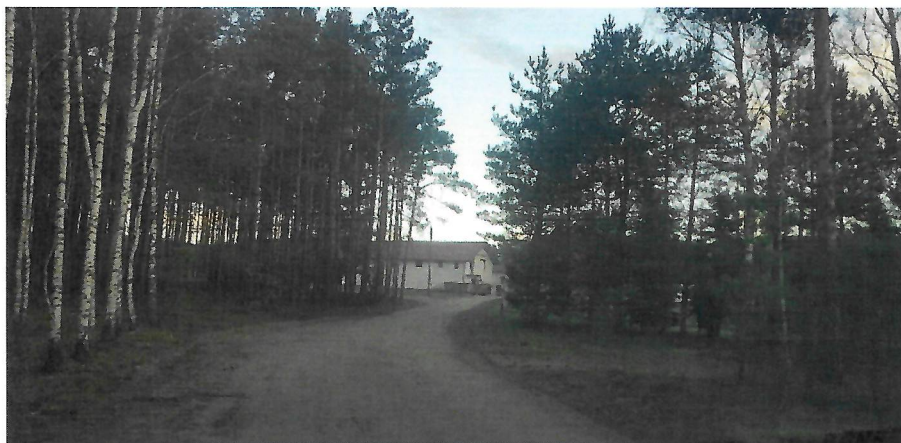
Fot. nr 3. Końcowy odcinek inwestycji. Z lewej strony planuje się zawrotkę o szerokości 12,5m.

Według obecnego projektu zamierza Pan wybudować w tym miejscu drogę z kostki betonowej. Biorąc pod uwagę koszty rozbudowy drogi w technologii z kostki betonowej o szerokości 5 m wraz z budową zawrotki o szerokości 12,5m inwestycja będzie kosztowała budżet wg moich szacunków ponad 300 000 zł. Skorzysta na niej w pełni jedno gospodarstwo domowe, o którym wspomniałem wcześniej. Próbowałem doszukać się w Pańskim działaniu logiki i racjonalności. Jednak zdecydowanie brakuje w tej sprawie kryteriów merytorycznych.