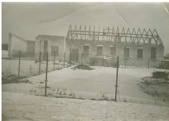
Świetlica wiejska z OSP w Gotelciu w trakcie bud. w 1982r.