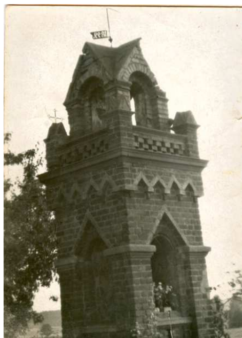
Kapliczka przed laty

Wieś Gotelp ma kilka ciekawych budynków w swoim obrębie. Takim jest z pewnością budynek poczty w Gotelciu, który wg mieszkańców został zbudowany w 1911 r. Obiekt,