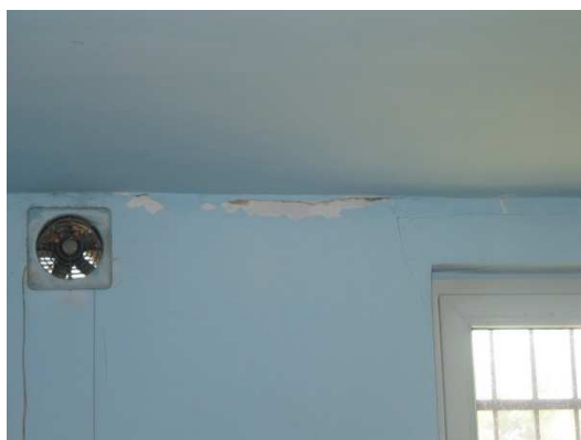
Fragment ścian kuchni w świetlicy