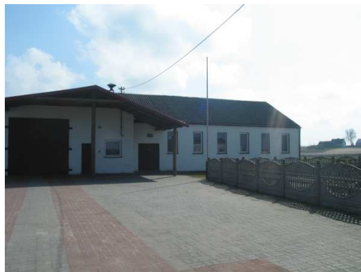
Świetlica wiejska z OSP w Gotelciu stan na dziś