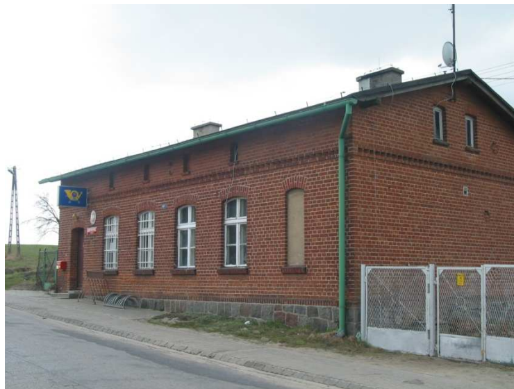
Filia czerskiego oddziału poczty w Gotelciu

wykonany z cegły, jest własnością Poczty Polskiej S.A i wykorzystywany jest przez filię poczty w Czersku w połowie swojej powierzchni. Filia czerskiego oddziału poczty, który oferuje usługi pocztowe i finansowe, istnieje od maja 2009 r., wcześniej mieścił się tu samodzielny oddział poczty w Gotelciu. Pozostała powierzchnia tego budynku wynajmowana jest prywatnej osobie na cele mieszkaniowe.