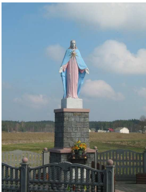
Figura Jezusa Chrystusa w Gotelciu

Kapliczka znajduje się na prywatnej posesji jednego z mieszkańców wsi. Możliwe, że jest najstarszym obiektem w całej wsi, ponieważ zbudowano ją w 1899 r. Przez lata była chroniona przez zniszczeniem i konserwowana przez kolejne pokolenia właścicieli posesji Gotelp 45.