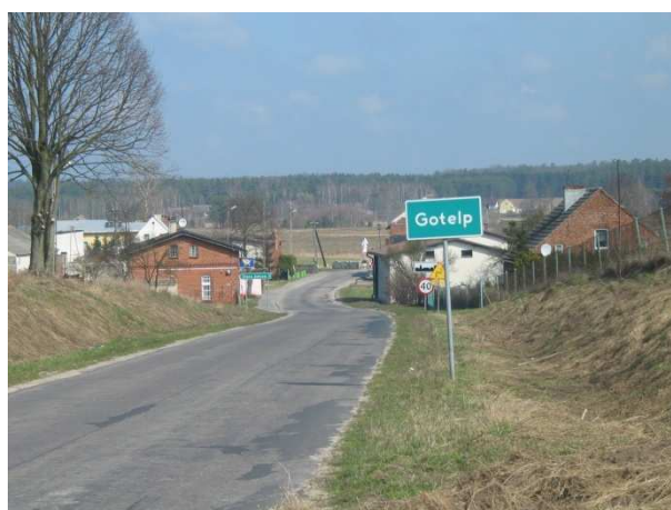
Widok na wjazd do Gotelcia od strony Czerska

Wieś sołecka Gotelc jest miejscowością bezładnie rozrzuconą, która nie tworzy zwartej skupiska domostw. Największe zagęszczenie zabudowań rozpościera się wzdłuż głównej drogi prowadzącej z Odrów do Czerska. Przy tej drodze usytuowane są również sklepy, poczta, dwa przystanki autobusowe, OSP ze świetlicą wiejską oraz szkoła. Wieś nie ma konkretnych ulic o własnych nazwach oraz ściśle wyodrębnionego centrum.