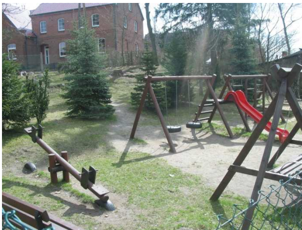
Plac zabaw przed szkołą podstawową w Gotelciu

Przed szkołą znajduje się plac zabaw, jedyne miejsce, gdzie miejscowe dzieci mogą spędzać wolny czas. Plac zabaw znajduje się tuż przy drodze Czersk – Odry, więc dzieci muszą być pod nieustanną opieką osób dorosłych.