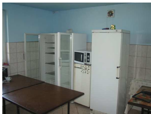
Wyposażenie kuchni w świetlicy