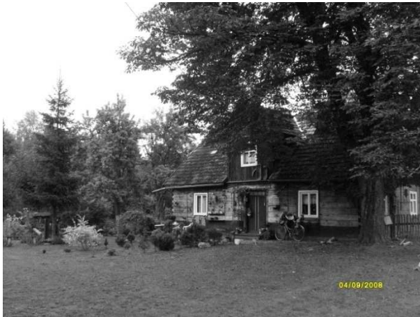
Drewniany dom zbud. w 1934 r.

maselnice, drewniane pralki. Dom, który kryje się pod adresem Gotelp 22, często odwiedzają turyści wracający z Rezerwatu archeologiczno – przyrodniczego Kręgi Kamienne w Odrach. Swoistym drogowskazem, pokazującym kierunek dojazdu do powyższego budynku jest przydrożny krzyż, który postawiono tu w 1981 r. w stanie wojennym z inicjatywy właścicieli domu. Figura Jezusa Chrystusa, która zdobi krzyż, jest od niego wiele starsza, przedwojenna.