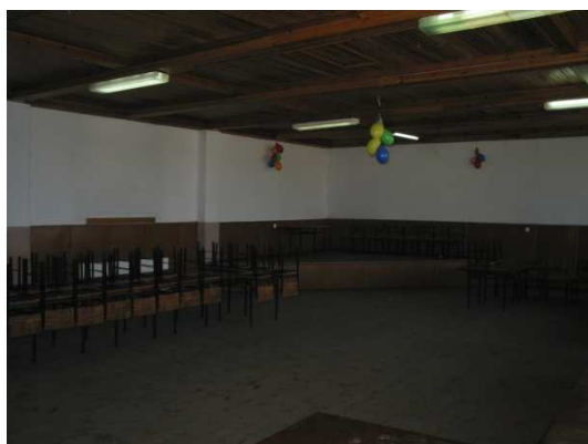
Sala widowiskowa świetlicy wiejskiej w Gotelciu