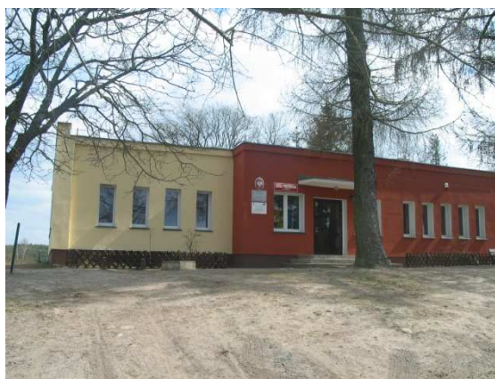
Szkoła podstawowa w Gotelciu część zbud. w 1887 r.