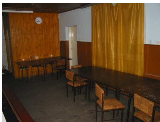
Część przedsionka świetlicy