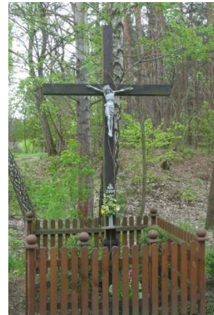
Krzyż przydrożny w Gotelpiu