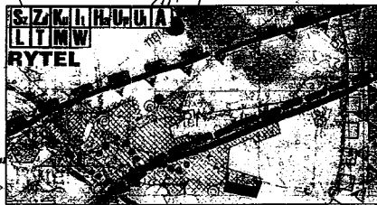
OBSZAR OBJĘTY PLANEM

WYRYS ZE STUDIUM UWARUNKOWAŃ I KIERUNKÓW ZAGOSPODAROWANIA PRZESTRZENNEGO MIASTA I GMINY CZERSK UCHWALONEGO UCHWAŁĄ NR XX/195/2000 RADY MIEJSKIEJ W CZERSKU Z DNIA 28 WRZEŚNIA 2000 R. SKALA 1:25 000