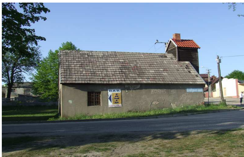
Fot. 2 Stara Remiza OSP w Rytlu.

Po lewej stronie budynku szkoły przy ulicy Ostrowskiej mieści się niewielki park z budynkiem poczty oraz drewnianym budynkiem byłej remizy OSP (obecnie własność prywatna). Obiekt byłby doskonałym miejscem dla Muzeum Wielkiego Kanału Brdy połączonego z Punktem Informacji Turystycznej w Rytlu.