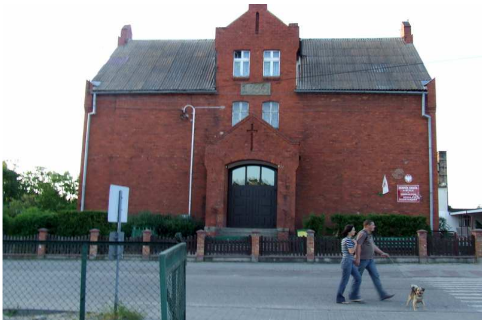
Fot. 1 Zdjęcie Szkoły od frontu