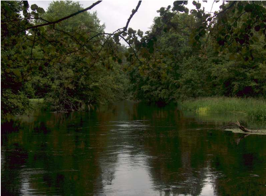
Fot. 10 Rzeka Brda.

Lasy porastają głównie drzewa iglaste a towarzyszą im brzoza, osika i dąb. Osobliwością jest modrzew polski, rodzimego pochodzenia.