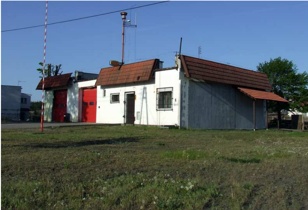
Fot. 19 Nowa Remiza Strażacka.