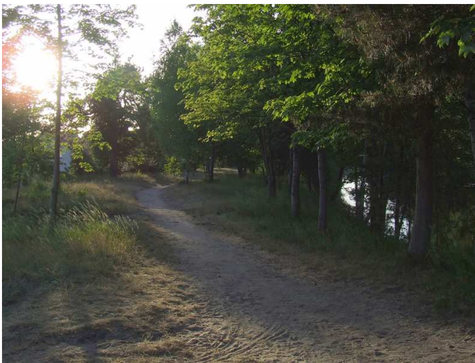
Fot. 16 Promenada przy Wielkim Kanale Brdy.

Pobliski plac przy Barze Jamir jest miejscem imprez na wolnym powietrzu, do największych należy zaliczyć „Noc Świętojańska”.