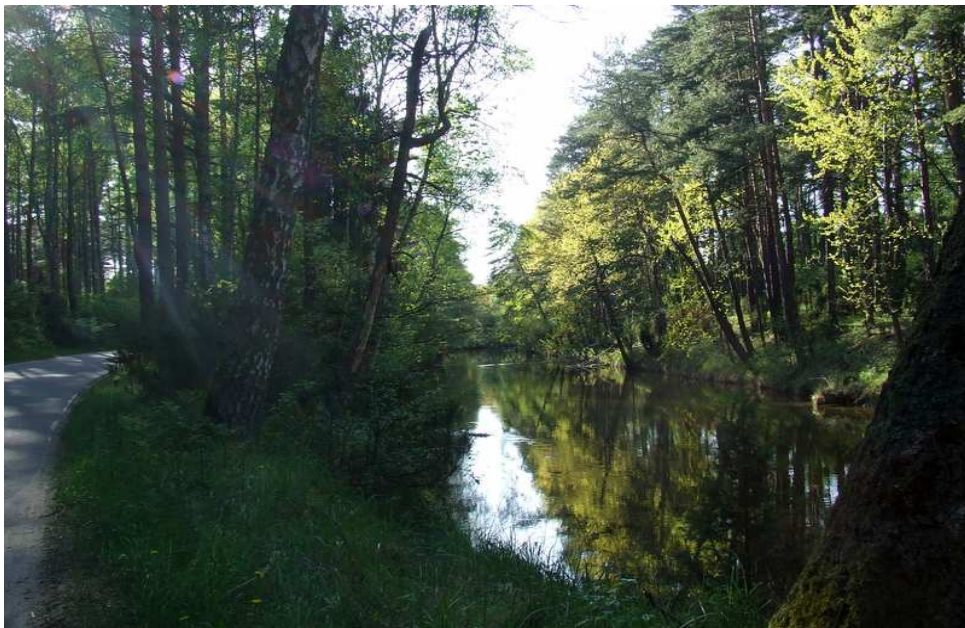
Fot. 7. Wielki Kanał Brdy.

Rzeka Brda oraz Wielki Kanał Brdy są miejscem gdzie odbywają się liczne spływy kajakowe o zasięgu ponadregionalnym, a nawet międzynarodowym.