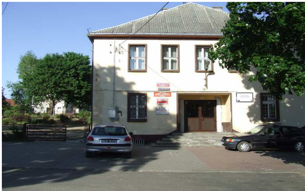
Fot. 4 Ośrodek Kultury w Rytle.

Budynek Ośrodka Kultury znajdujący się naprzeciw Wielkiego Kanału Brdy jest również siedzibą Przedszkola samorządowego wchodzącego w skład Zespołu Szkół w Rytle. Przy bocznej części budynku znajduje się plac zabaw dla dzieci.