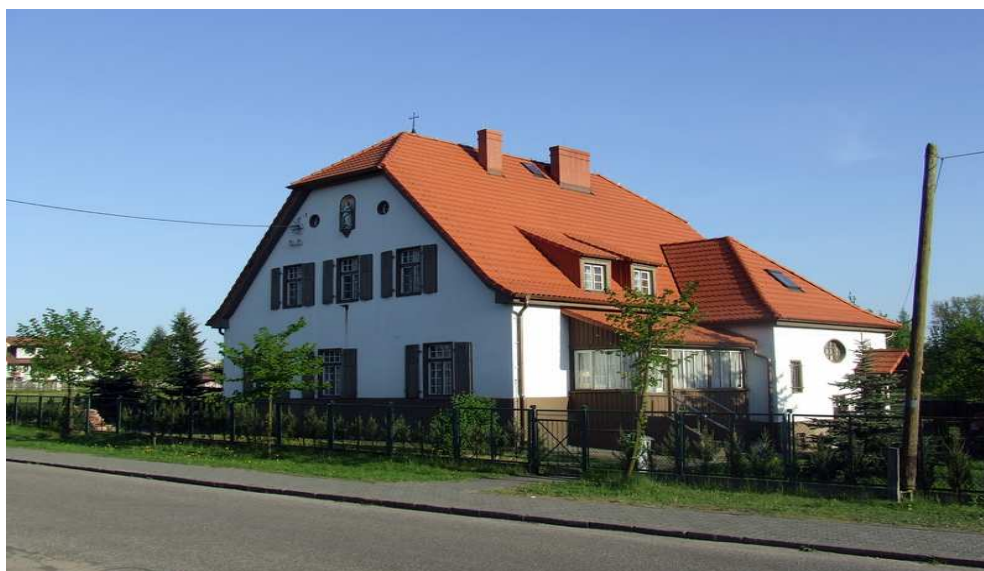
Fot. 12 Plebania w Rytlu.