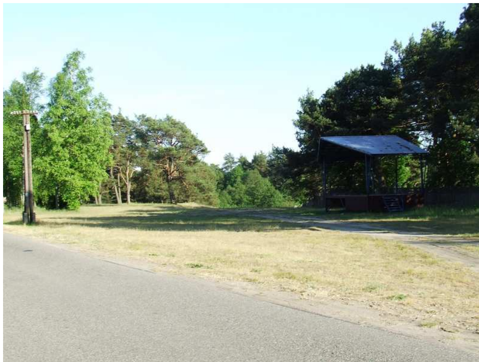
Fot. 5 Miejsce organizacji imprez na wolnym powietrzu „Pod Dużą Górą”.

o zasięgu gminnym i regionalnym. W roku 2004 odbyły się w Rytle wojewódzkie i diecezjalne Dożynki.