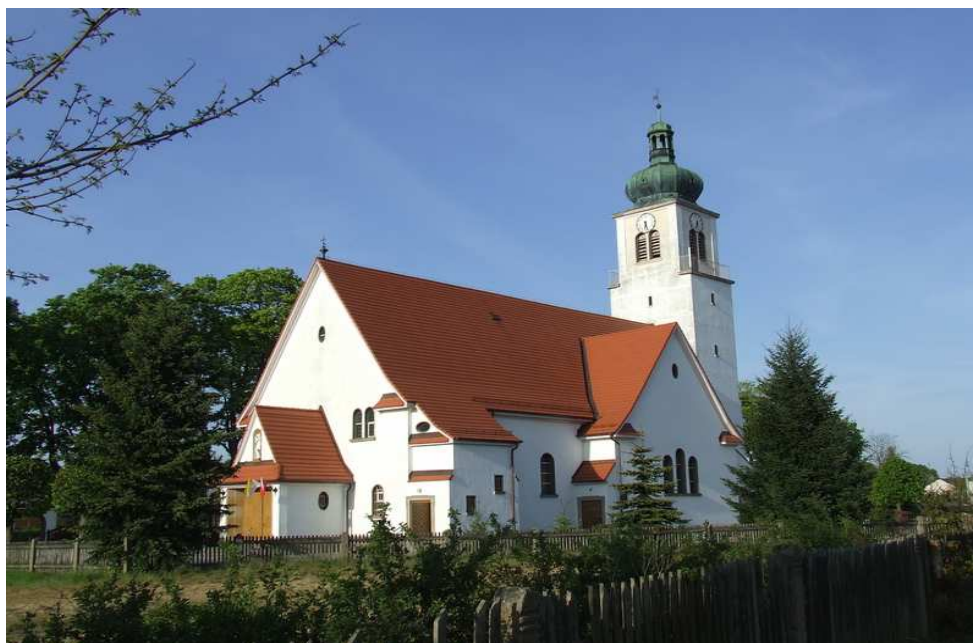
Fot. 11 Kościół Parafialny w Rytlu.