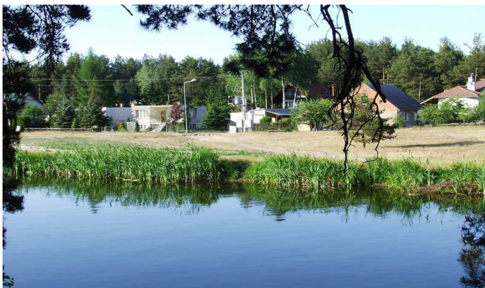
Fot. 17 Wielki Kanał Brdy – planowane miejsce na kąpielisko.

Pobliski plac przy Barze Jamir jest miejscem imprez na wolnym powietrzu, do największych należy zaliczyć „Noc Świętojańska”.