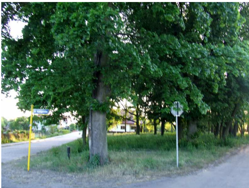
Fot. 13 Cmentarz Ewangelicki w Rytlu