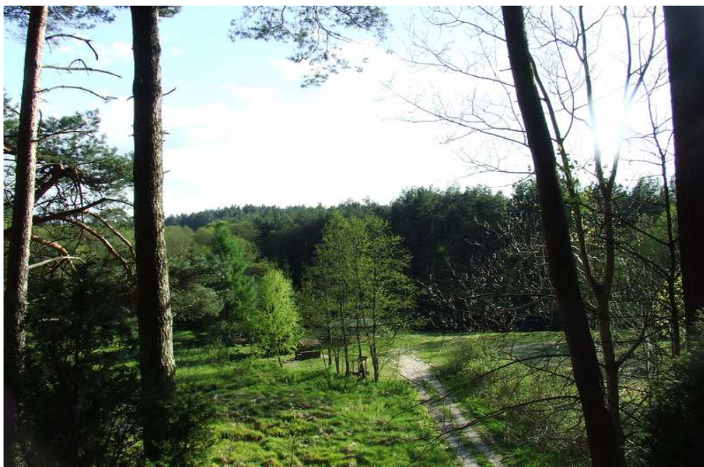
Fot. 8 Lasy w okolicach Rytla.