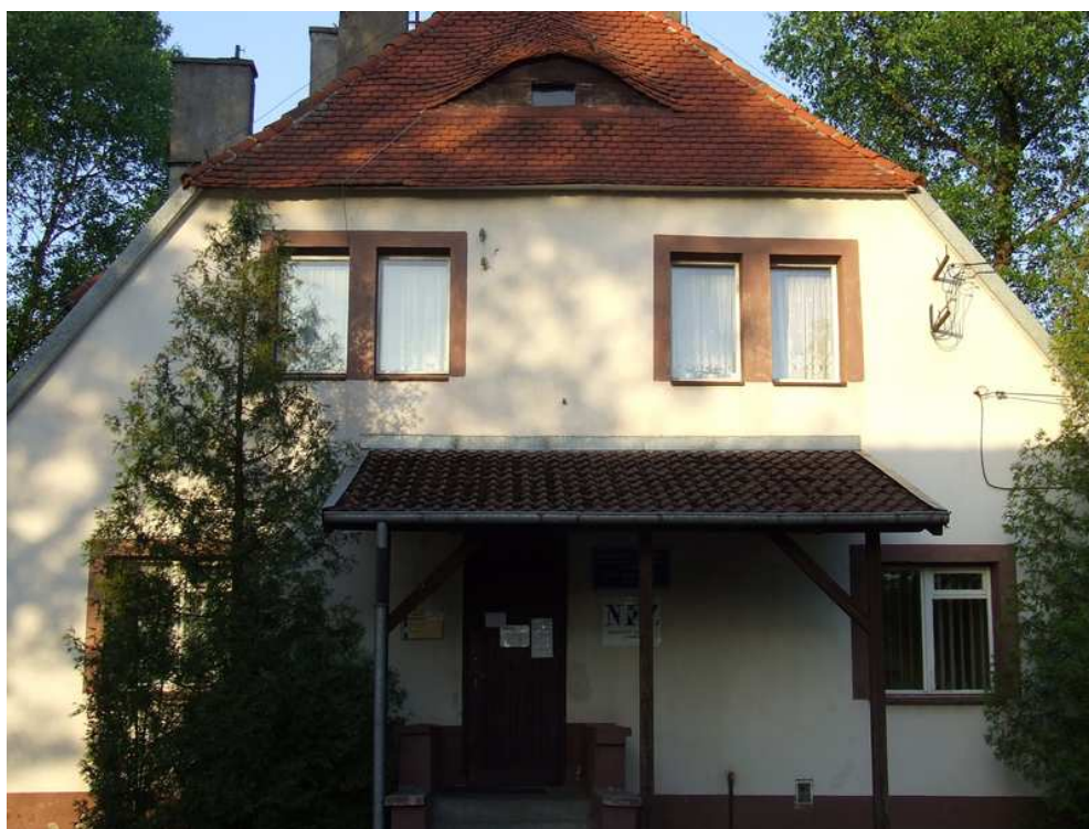
Fot. 14 Obecny Ośrodek Zdrowia ( była Plebania Ewangelicka)