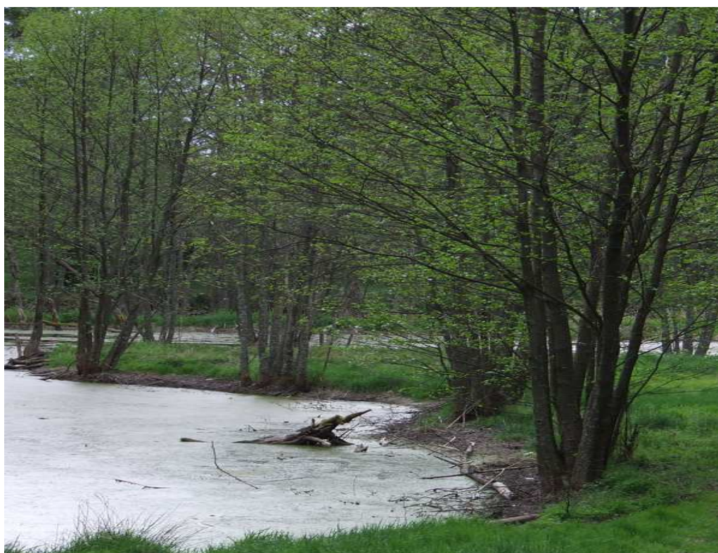
Fot. 9 Rzeka Brda.