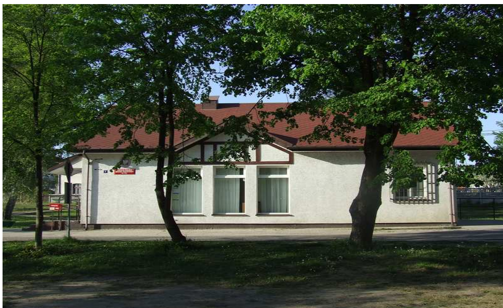
Fot. 3 Budynek Poczty Polskiej.

Budynek Ośrodka Kultury znajdujący się naprzeciw Wielkiego Kanału Brdy jest również siedzibą Przedszkola samorządowego wchodzącego w skład Zespołu Szkół w Rytle. Przy bocznej części budynku znajduje się plac zabaw dla dzieci.