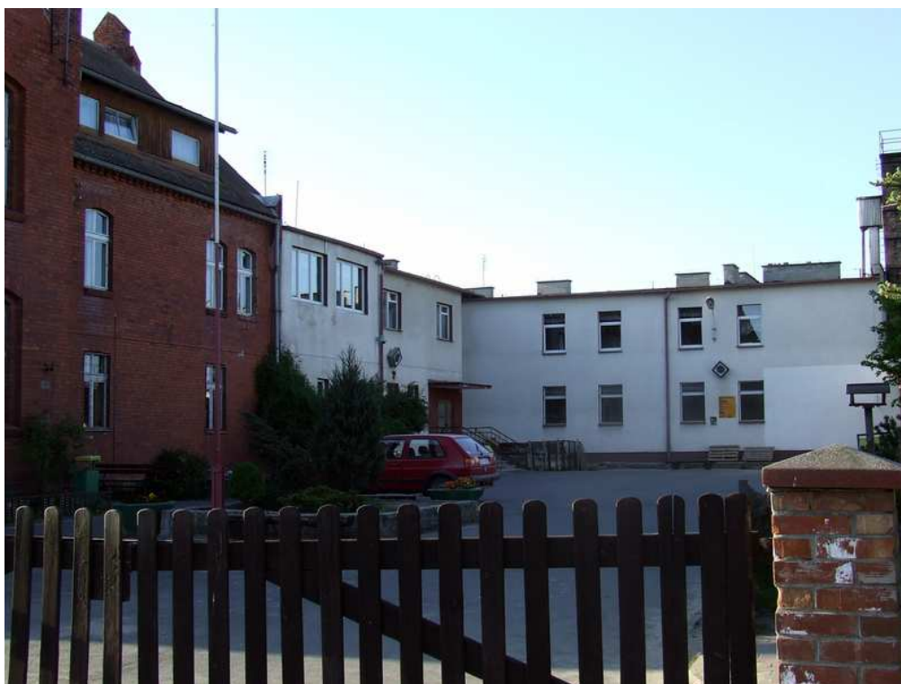
Fot. 18 Zespół Szkół w Rytlu.

Na terenie sołectwa w ramach Zespołu Szkół funkcjonuje przedszkole, szkoła podstawowa oraz gimnazjum.