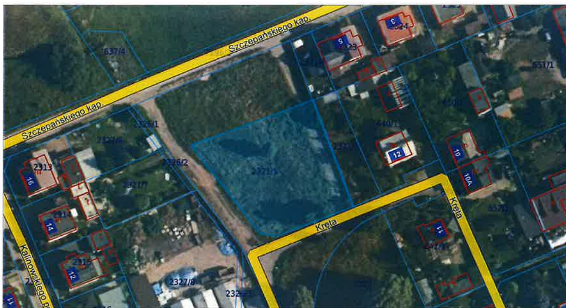
Ryc. 1. Obszar objęty konsultacjami społecznymi (kolor jasnoniebieski) na tle ortofotomapy

Projekt MPZP obejmuje część działki nr 2321/5 w mieście Czersk, zlokalizowanej między ulicami Krętą i Kapitana Szczepańskiego (wskazaną na poniższej rycinie). Projekt zakłada na danym terenie realizację funkcji usługowej – usług sportu i rekreacji, wspólnie z zielenią urządzoną. Docelowo planuje się, aby powstał tam ogólnodostępny plac zabaw.