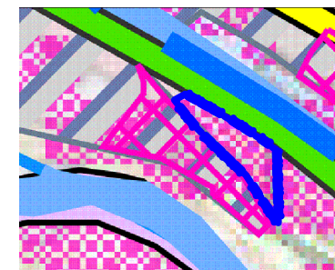
Granica obszaru objętego planem