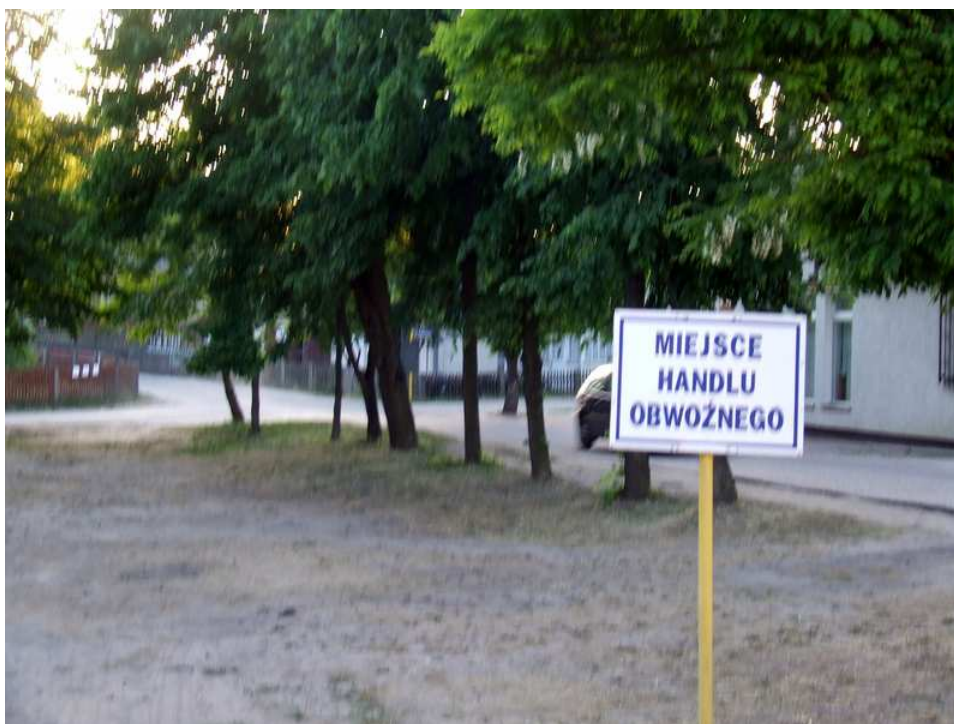
Fot. 15 Plac targowy w Rytle.

Rytel posiada kilka skwerów, plac targowy, plac między kanałem a rzeką Brdą wykorzystywany do organizacji imprez plenerowych.