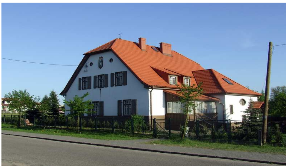
Fot. 12 Plebania w Rytlu.