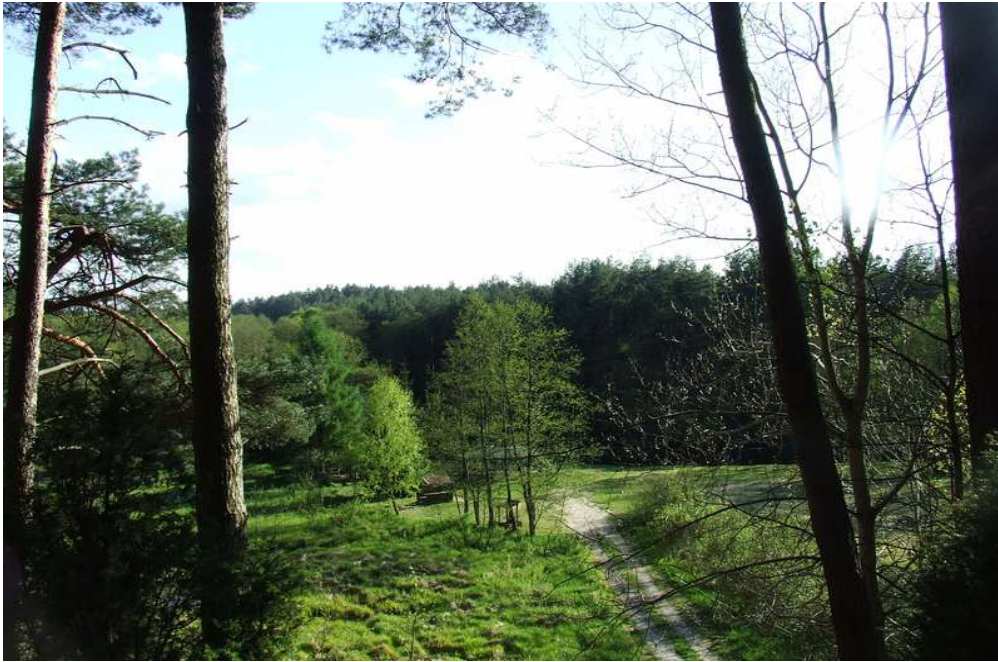
Fot. 8 Lasy w okolicach Rytla.