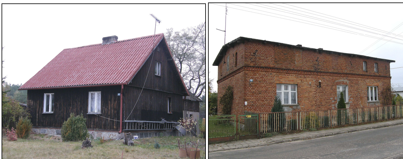
Fot. Drewniane budownictwo w Złym Mięsie oraz dom z czerwonej cegły – Lipki Dolne

Ponadto w Lipkach oraz Złym Mięsie można znaleźć kilka domów z typowej dla pruskiego budownictwa czerwonej cegły oraz kilka domów z drewna. Wszystkie są zamieszkałe.