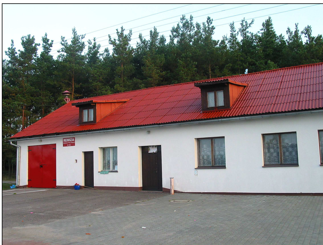
Fot. Świetlica wiejska w Żłym Mięsie

ścian. Wewnątrz mieści się duża sala spotkań miejscowej ludności oraz kuchnia i toalety. Największym mankamentem jest brak wyposażenia świetlicy oraz kuchni. Najbardziej pilny jest zakup sprzętu i wyposażenia pozwalającego na organizowanie w świetlicy wiejskiej, zajęć dla dzieci, młodzieży i innych grup mieszkańców. Priorytetem jest także doposażenie kuchni w sprzęt AGD, pozwalające na organizację imprez okolicznościowych. Mieszkańcy wskazują także na potrzebe zadaszenia wejścia do budynku od strony ulicy, co znacznie powiększyło by część użytkową budynku. Stoi on bowiem na niewielkiej działce i nie możliwości jej zagospodarowania. Teren powinien być także zabezpieczony (ogrodzony) od strony ulicy.