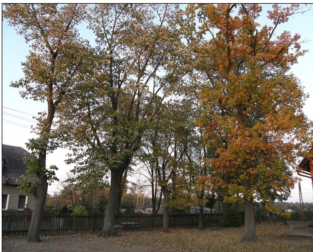
Fot. Stare drzewa na placu szkolnym w Lipkach

Opisując zasoby przyrodnicze sołectwa nie sposób nie wspomnieć o zieleni, znajdującej się w poszczególnych miejscowościach. Występują tu bowiem ciekawe nasadzenia – wzdłuż drogi z Lipiek do Kęszy m.in. jarzębiny, brzozy, klony, dęby, sosny, a także wysoki świerk. Piękne, stare drzewa – dęby i klony rosną przy miejscowej szkole. Ponadto plac szkolny obsadzony został młodymi świerkami. Natomiast w Złym Mięsie – przy figurze – spotykamy rzadki tu kasztanowiec, zaś przy przydrożnym krzyżu między Lipkami a Kęsą – dwa, stare klony.