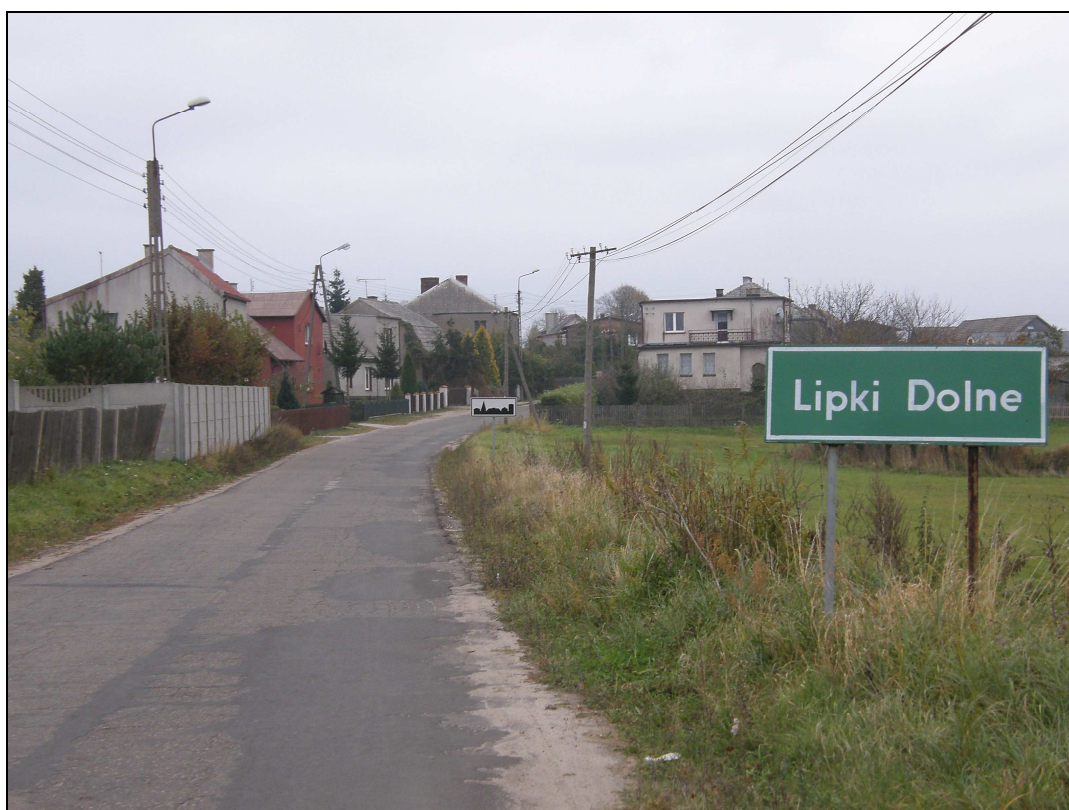
Fot. Wjazd do Lipiek Dolnych od strony Łęga

Podobny charakter mają Lipki Dolne , z tym, że droga powiatowa Łąg-Szlachta jest na tym odcinku wąska (ok. 3,5 m) oraz bardzo kręta.