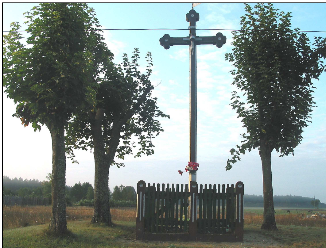
Fot. Krzyż w Złym Mięsie

Ponadto w sołectwie znajdują się dwa przydrożne krzyże – w Złym Mięsie przy głównej drodze oraz pomiędzy Lipkami Dolnymi i Kęszą. Szczególnie ten ostatni krzyż wymaga renowacji.