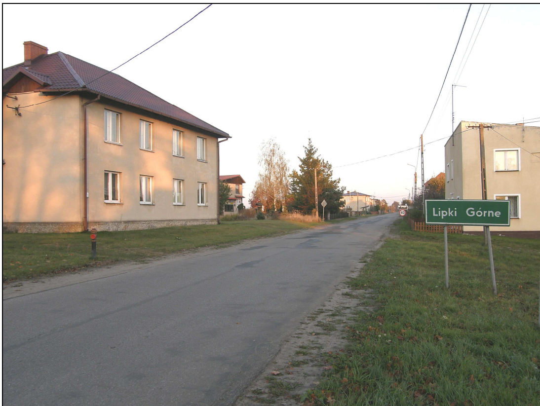
Fot. Wjazd do Lipiek Górnych od strony Łęga

Lipki Górne to typowa „ulicówka”, o przeważającej zwartej zabudowie koncentrującej się nad asfaltową drogą powiatową Łąg – Skrzynia.