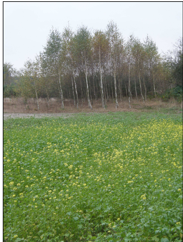
Fot. Kanał melioracyjny z łąk w okolicach Kęszy doływa do Złego Mięsa; obok – typowy krajobraz 2. Dziedzictwo kulturowe