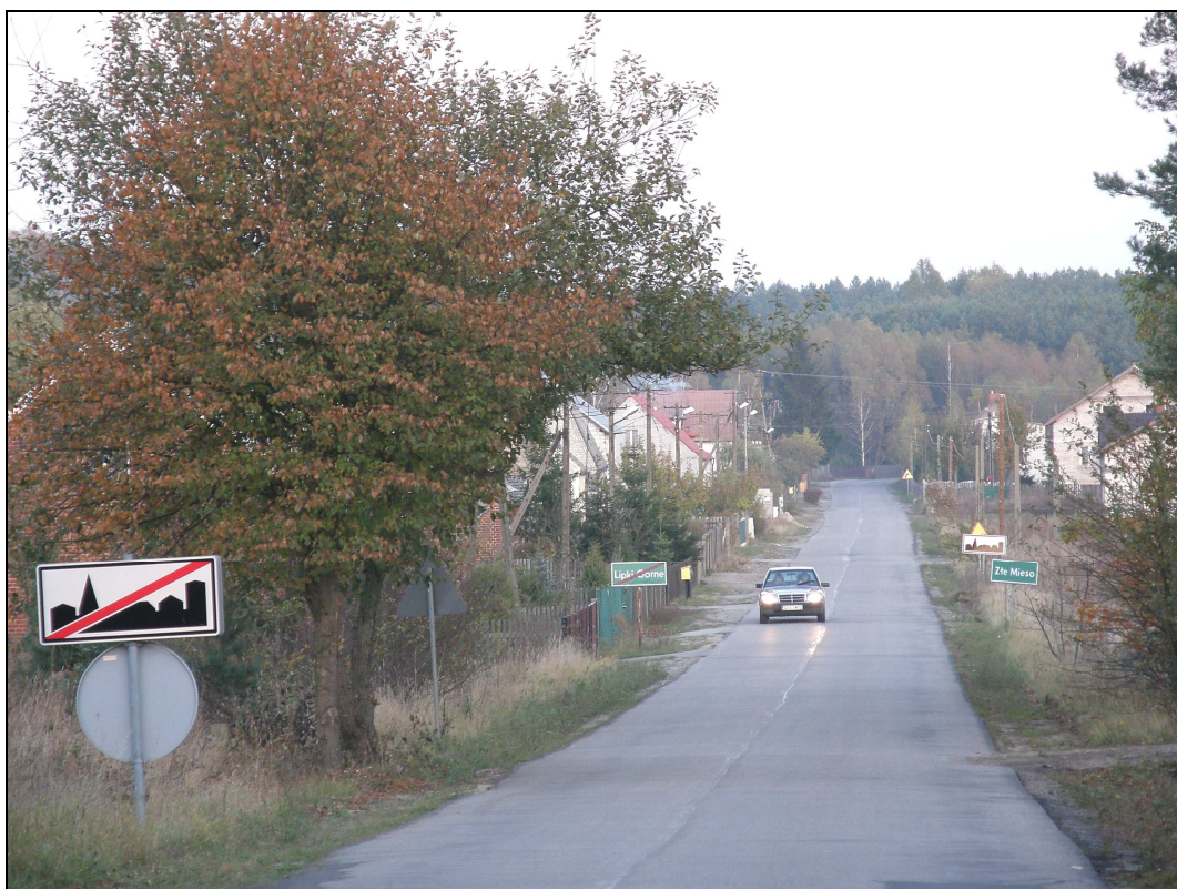
Fot. Wjazd do Złego Mięsa od strony Lipek