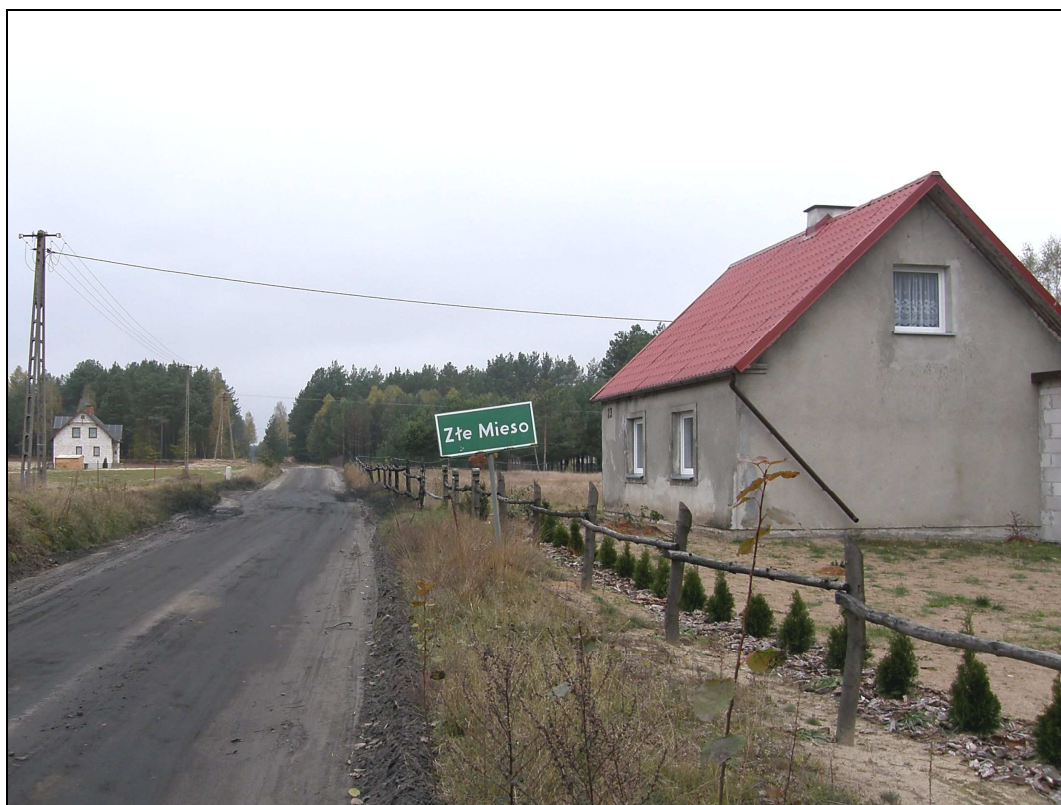
Fot. Złe Mięso od strony Jastrzębia – widoczna droga gruntowa oraz punktowa zabudowa