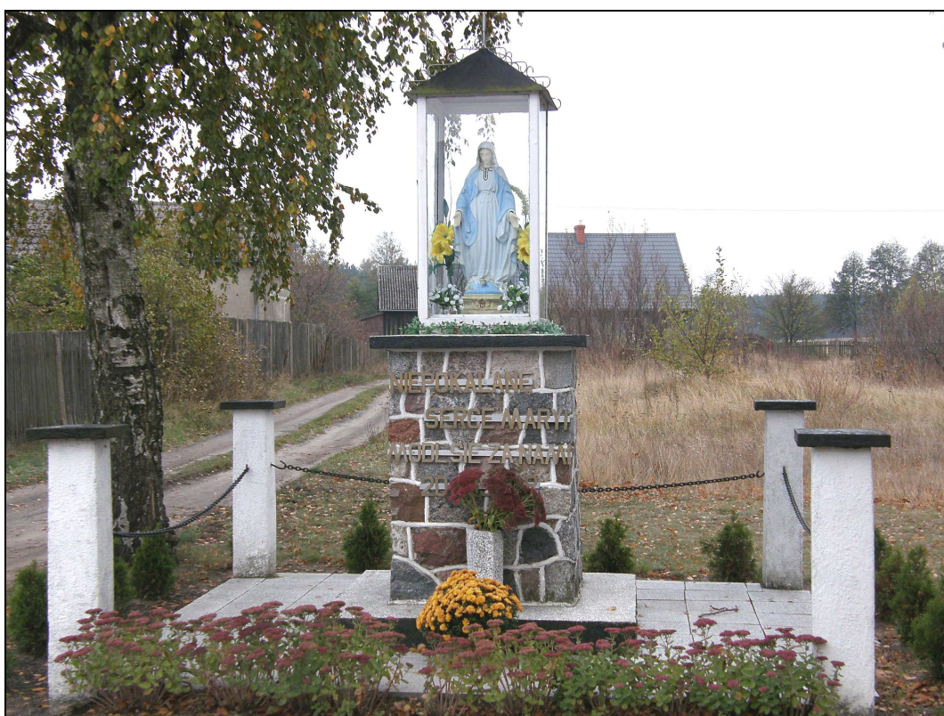
Fot. Kapliczka w Złym Mięsie

Kapliczki z figurami Matki Boskiej znajdują się w Złym Mięsie oraz w Lipkach – przy sklepie spożywczym. Kapliczka w Złym Mięsie jest odrestaurowana – na kamiennym postumencie wznosi się niewielka figurka Maryi, zabezpieczona szkłem. Na postumencie znajduje się napis: „Niepokalane Serce Maryi, Módl się za nami!”. Dokoła kapliczki wiszą łańcuchy, obok stoją drewniane ławeczki. Kapliczka obsadzona jest bylinami oraz żywotnikami.