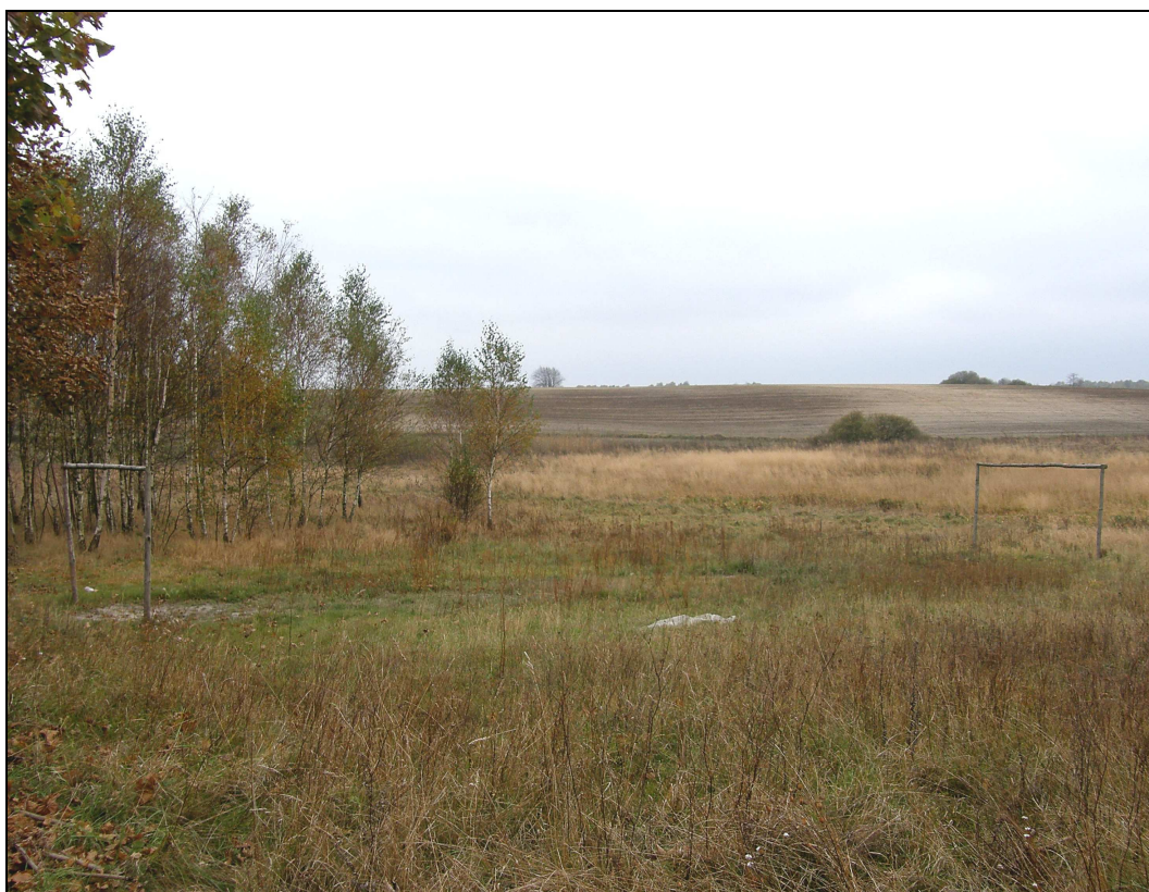
Fot. Boisko do gry w piłkę dzieci z Lipiek i Kęszy

Na terenie sołectwa nie ma niestety żadnego profesjonalnego boiska ani placu rekreacyjnego, umożliwiającego zabawę i uprawianie sportu dzieciom. Jest to jedna z najbardziej dotkliwych barier w życiu społecznym, która wpływa bezpośrednio na obniżenie jakości życia i nierówność szans w rozwoju tutejszych dzieci. O ogromnej potrzebie zorganizowania takiego miejsca świadczą próby zorganizowania choćby niewielkiego, niewymiarowego boiska do gry w piłkę nożną. Taki plac zauważyć można m.in. w Kęszy – tuż za mostkiem, gdzie na niewielkiej działce ustawiono dwie, drewniane bramki. Miejsce to jednak jest niebezpieczne – blisko drogi i rowu melioracyjnego.