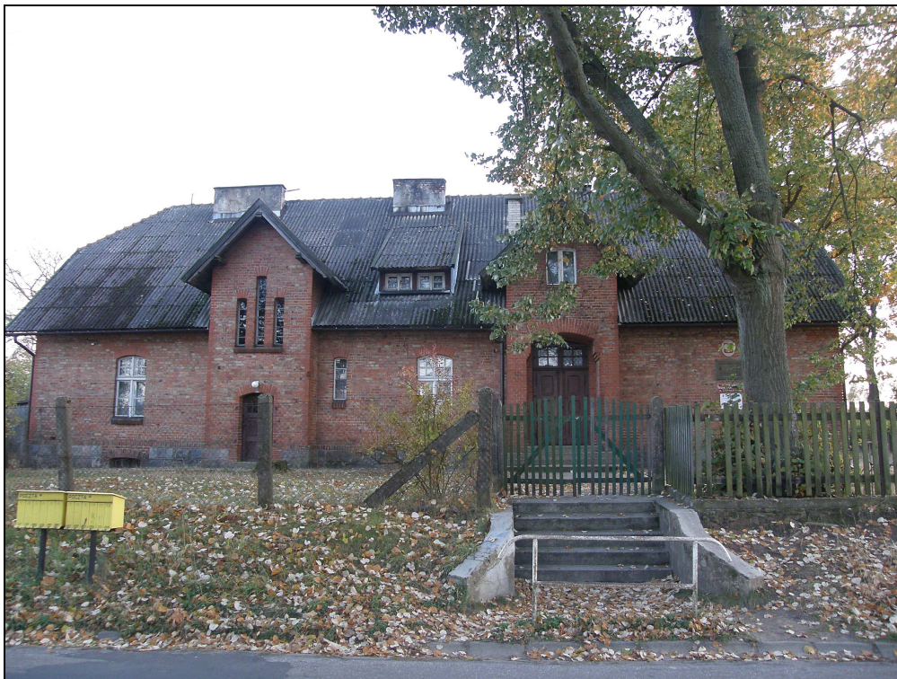
Fot. Szkoła w Lipkach

Oprócz kapliczek i krzyży w sołectwie można spotkać kilka budynków z przełomu XIX/XX w. Jednym z nich jest budynek miejscowej szkoły podstawowej. Budynek zbudowany jest w typowo „pruskim” stylu – na kamiennym fundamencie, ściany z czerwonej cegły. Budynek jest okazały, wejścia znajdują się od strony ulicy i od podwórka.