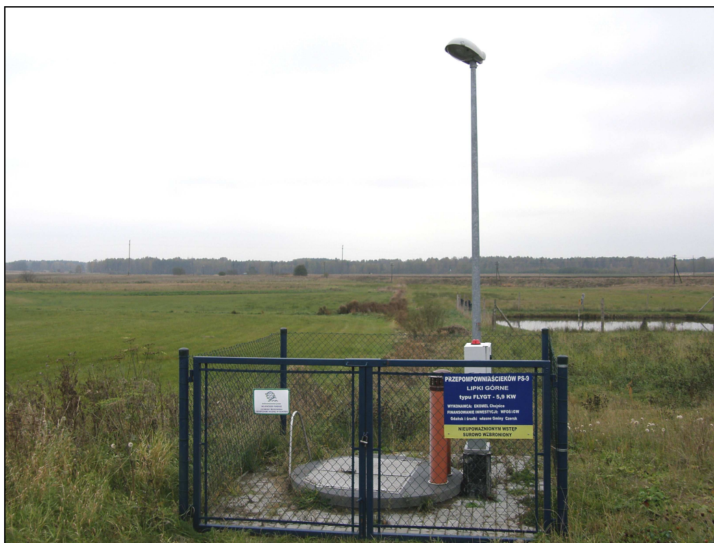
Fot. Przepompownia ścieków w Lipkach

Zabudowa domów zwarta, budynki w większości współczesne, otynkowane – sporadycznie spotkać można budynki z czerwonej cegły. Na „wylocie” w kierunku Kęszy zabudowa jest luźniejsza, po prawej stronie podmokłe łąki, zaś droga obsadzona jest punktowo drzewami: klonami, dębami, jarzębiną, brzoza, na niewielkim wzniesieniu rośnie tu także brzozowy zagajnik. Widoczne są także fundamenty starego domostwa. Tuż za nim, na charakterystycznym, ostrym zakręcie stoi drewniany krzyż z sygnaturką z 1992 r. Otaczają go dwa stare klony, a w niedalekim sąsiedztwie rośnie strzelisty, wysoki świerk.