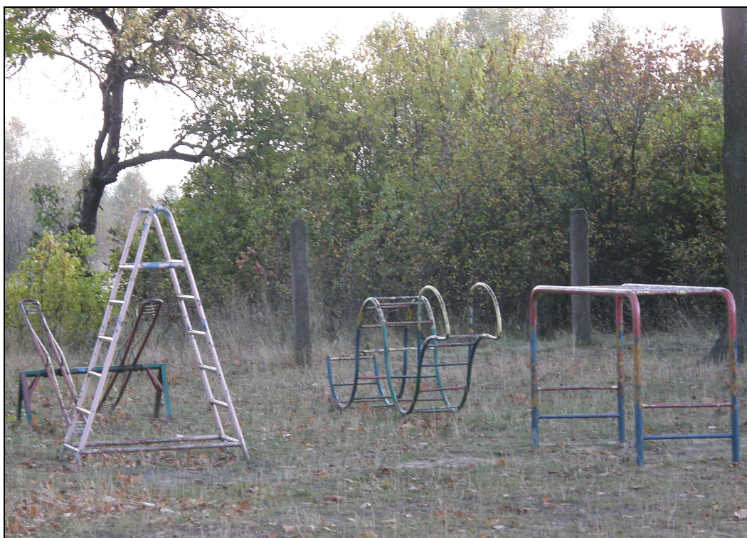
Fot. Plac zabaw przy szkole w Lipkach