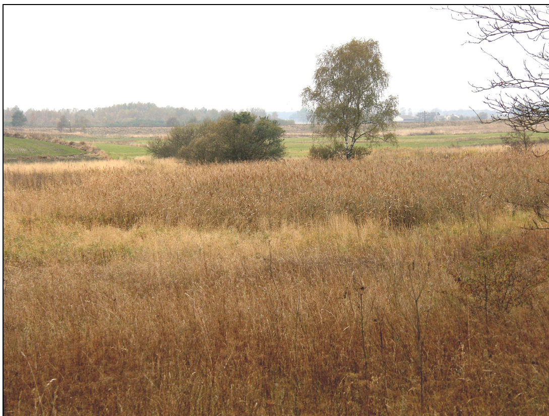
Fot. Typowy krajobraz okolic Lipek i Kęszy

Pod względem administracji leśnej Sołectwo Lipki leży na terenie administrowanym przez Nadleśnictwo Lubichowo, leśnictwo Szary Kierz oraz częściowo przez Nadleśnictwo Woziwoda. Ponadto znajdujące się tutaj lasy prywatne (okolice Lipek) znajdują się pod zarządem Nadleśnictwa Czersk. Należy jednak zaznaczyć, iż teren sołectwa ma co do zasady charakter rolniczy. Występują tu bowiem liczne obniżenia wytopiskowe o nieregularnych kształtach, usytuowane między wzniesieniami. Obniżenia te reprezentują krajobraz równinny łąk, miejscami porośniętych krzakami. Ten rodzaj krajobrazu jest charakterystyczny przede wszystkim dla okolic Lipek. Natomiast zwarty las widoczny jest na obrzeżach Złego Mięsa i za zabudową Kęszy.