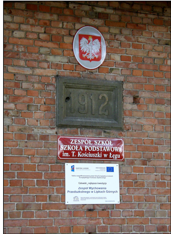
Fot. Szkoła w Lipkach zbudowana w latach 70-tych XIX w., rozbudowana - 1912

Z kolei pustki - o późniejszej nazwie Złe Mięso - istniały już w XIV w. Wg niektórych, nazwa „Złe Mięso” pochodzi od nazwiska karczmarza Bösenfleisch , który w 1480 r. prowadził we wsi karczmę. Złe Mięso pojawia się w wzmiankach z XVI w, opisujących stan parafii w Czersku. Jak podają źródła z lat 1583 -1584 (sporządzone z okazji wizytacji kościelnej biskupa Rozrażewskiego) Złe Mięso wchodziło w skład czerskiej parafii, łącznie m.in.z Łęgiem, Legbądem czy Będźmierowicami. Wspomnieć trzeba przy tym, iż przynależność do czerskiej parafii archiwa potwierdzają w kolejnych latach (1686 r., 1780 r.) trwała do roku 1859, kiedy to parafię w Łęgu z filialnej parafii Czerska uczyniono oddzielną parafią.