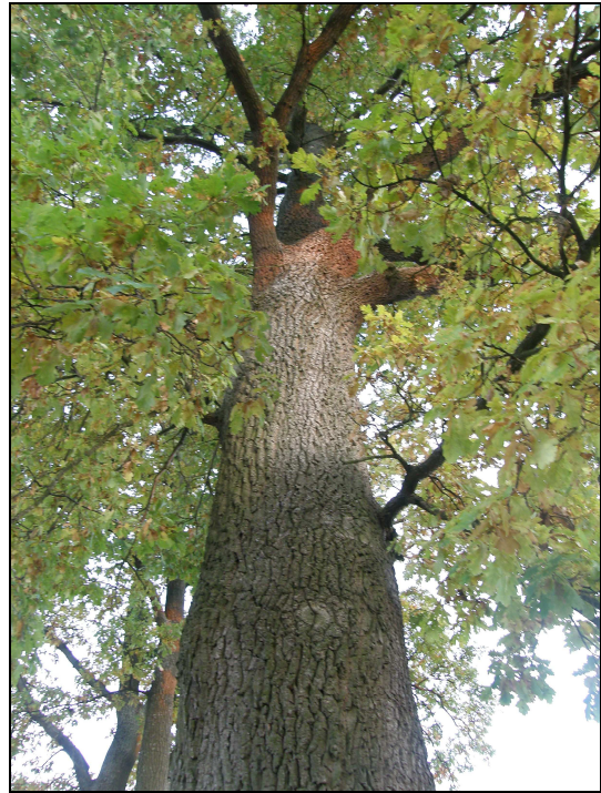
Fot. Okazaty dąb na placu szkolnym w Lipkach.

Charakterystyczne dla terenu sołectwa jest także występowanie sztucznie wykopanych rowów melioracyjnych, służących odwadnianiu podmokłych łąk – m.in. w okolicach Kęszy. Widoczna jest tu także roślinność typowa dla tego typu siedlisk – obrzeża Kęszy porastają trzciny i wysokie trawy.