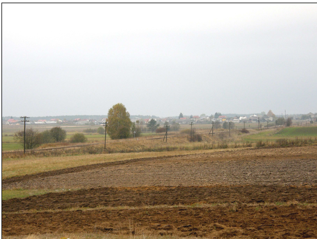
Fot. Linia kolejowa Kościerzyna-Bydgoszcz, wzdłuż której rozciąga się Kęsza

Kolejna wieś sołectwa Lipki to Złe Mięso . Zabudowa wsi koncentruje się po lewej stronie – jadąc od Lipiek Górnych. Tu również znajduje się oświetlenie uliczne oraz linia energetyczna. Prawa strona wsi to rozległe działki, niezabudowane i dotąd niezagospodarowane. Na ich skraju znajduje się przydrożny krzyż, a ok.100 m dalej – remiza OSP oraz świetlica wiejska. Jest to jedyny obiekt pełniący funkcję społeczną w sołectwie. Teren obok remizy fragmentarycznie obsadzony jest krzewami, tworzącymi żywopłot. Wejście do remizy od strony ulicy wyłożone jest kostką brukową. Ok.300 m od remizy przekraczamy mostek na drodze, zabezpieczony opaską. Płyń tu lokalna struga, teren wokół jest zalesiony. Za mostkiem znajduje się kilka pojedynczych domów i trzy lampy uliczne. Następnie droga powiatowa zmienia charakter nawierzchni – kończy się asfaltowa, a wjeżdżamy na drogę gruntową. Ciągnie się ona już do końca wsi, a jednocześnie granic gminy. Tereny nad drogą mają już bardziej leśny charakter – rosną tu sosnowe lasy, a na poboczach punktowe nasadzenia brzozy i dębów. Również zabudowa zmienia swój charakter na bardziej luźny, wtopiony w leśny krajobraz. Warto dodać, iż właśnie w centralnym i końcowym odcinku wsi powstaje wiele nowych domów, zarówno całorocznych, jak i letniskowych.