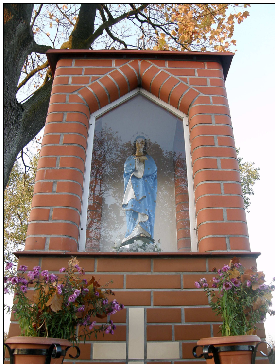
Fot. Kapliczka w Lipkach

Ponadto w sołectwie znajdują się dwa przydrożne krzyże – w Złym Mięsie przy głównej drodze oraz pomiędzy Lipkami Dolnymi i Kęszą. Szczególnie ten ostatni krzyż wymaga renowacji.