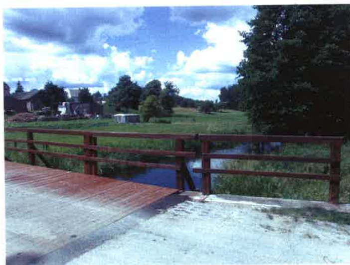
Most na rzece Niechwaszcz

Jadąc drogą gminną w kierunku Odrów turysta może zobaczyć przepływającą tu rzekę Niechwaszcz oraz przejechać po drewnianym moście powstałym w 1995 r.