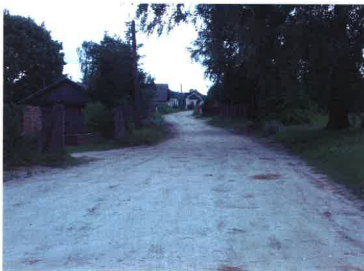
Droga powiatowa w Pustkach

Na terenie wsi funkcjonuje gminna sieć wodociągowa, brakuje jednak sieci kanalizacyjnej. Mieszkańcy w obrębie swoich zabudowań posiadają przydomowe studnie oraz bezodpływowe zbiorniki na nieczystości płynne, czyli tzw. szamba. Główna droga, która przebiega przez całą wieś ma nawierzchnię gruntową, w związku z czym wymaga ciągłych nakładów inwestycyjnych dotyczących jej wyrównywania i utwardzania. Brak nawierzchni asfaltowej na tej drodze skutkuje systematycznymi utrudnieniami dla mieszkańców. Odpady stałe od mieszkańców odbierane są przez Zakład Usług Komunalnych Sp. z o.o. w Czersk.