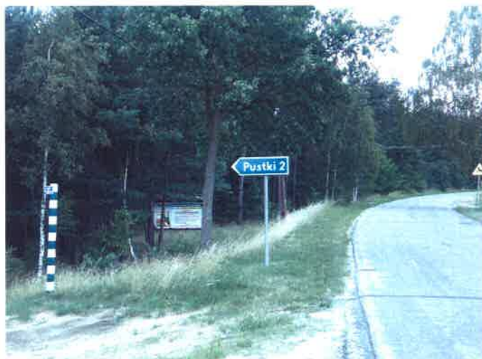
Zjazd z drogi powiatowej Czersk – Odry w kierunku Pustek

Charakterystyczną cechą tej wsi jest to, że nigdy nie zbudowano tu kościoła ani kaplicy. Przyczynami są zapewne wielkość wsi, niewielka ilość mieszkańców oraz bliskość Odrów. Z tego powodu Pustki od wielu lat należą do parafii p.w. Wniebowzięcia Najświętszej Marii Panny w Odrach.