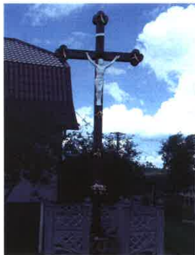
Krzyż przydrożny w Pustkach

Najcenniejszym i jednocześnie jedynym obiektem dziedzictwa kulturowego wsi Pustki jest krzyż stojący przy głównej drodze wsi, wśród zabudowań. Istniejący obecnie krzyż jest trzecim istniejącym we wsi Pustki. Pierwszy krzyż został zbudowany przed II wojną światową. Tak jak większość kapliczek oraz krzyży zlokalizowanych w tamtym okresie na terenie gminy Czersk, krzyż z Pustek został zniszczony przez Niemców. Po wojnie krzyż odbudowali mieszkańcy z własnych środków finansowych. Obecny krzyż postawiono w 1993 r.