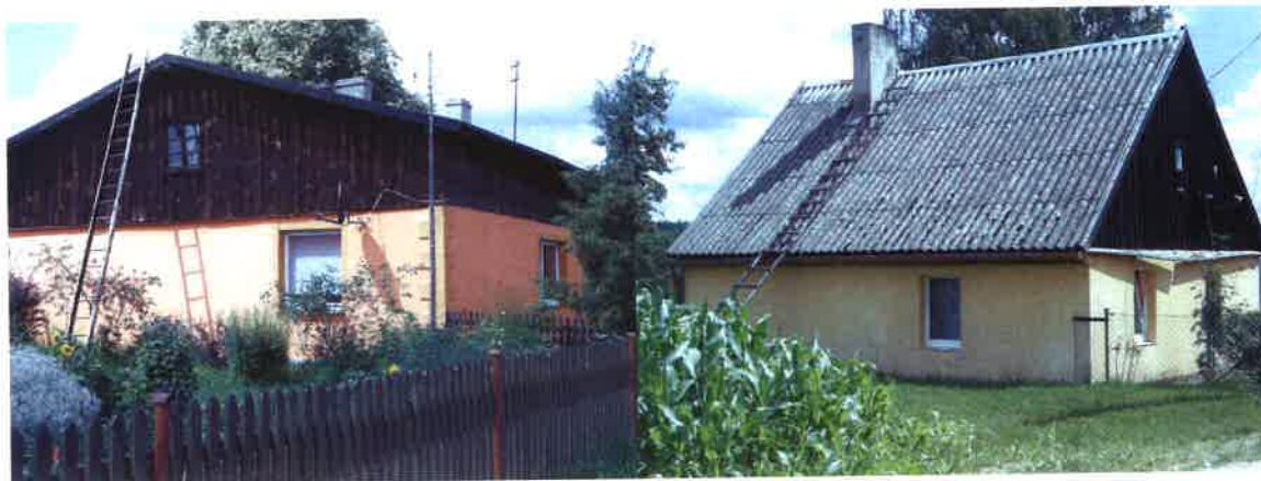
Wiekowe domy w Pustkach

We wsi Pustki znajdują się ok. 30 zabudowań mieszkańców oraz krzyż przydrożny. Zobaczyć można tu również domy mieszkalne, które liczą sobie ponad 100 lat, szczególnie zlokalizowane pod adresem Pustki 13 oraz 14. Na terenie wsi brakuje placu zabaw oraz boiska dla młodzieży i najmłodszych.