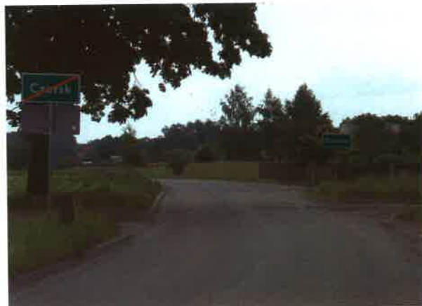
Wyjazd z Czerska do Złotowa od strony Klaskawy