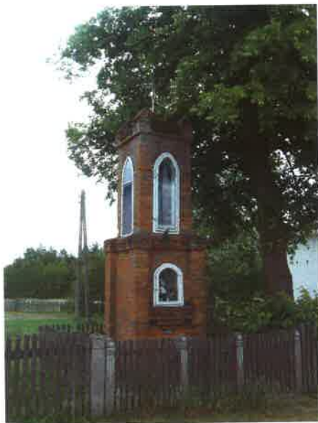
Kapliczka w Łukowie