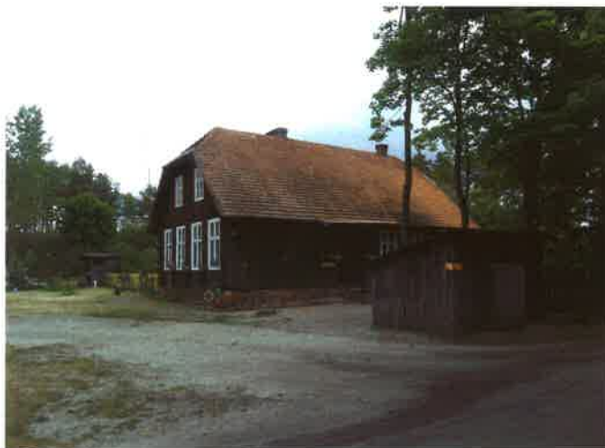
Budynek dawnej szkoły w Łukowie