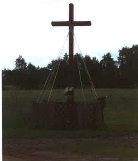
Krzyż w Złotowie