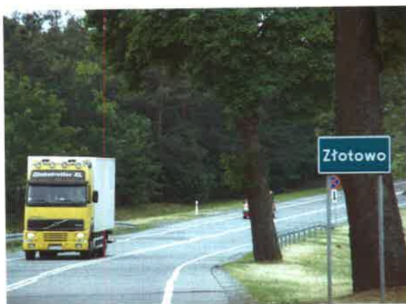
Wjazd do Złotowa od strony Łęga

Układ przestrzenny wsi można określić jako nietypowy, rozwlekły. Złotowo położone jest wokół Czerska i stanowi niepełny pierścień opasający to miasto. Na terenie miejscowości wyróżnić można kilka ulic takich jak Bukowa, Gajowa, Klaskawska, Śliwicka, Złotowska oraz następujące tereny Wybudowanie pod Łąg, Wybudowanie pod Łubną, Wybudowanie pod Łukowo, Wybudowanie pod Malachin, Wybudowanie pod Strugę oraz Wybudowanie pod Tucholę. Z powodu wyjątkowego charakteru, czyli położenia względem Czerska, nie sposób określić centrum Złotowa. Tereny sołectwa w dużej mierze stanowią gospodarstwa oraz w pewnej części las.