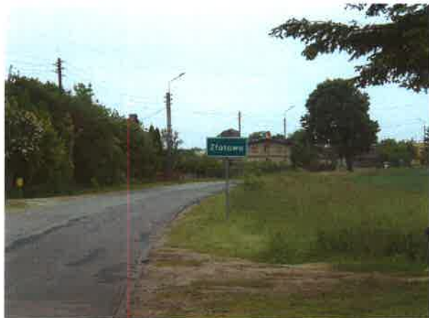
Wjazd do Złotowa od strony Łubnej