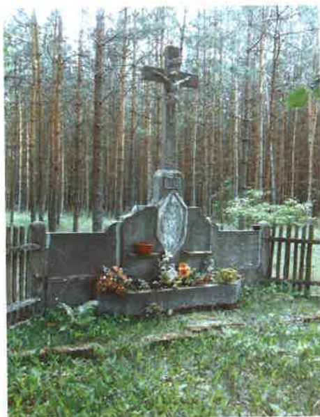
Krzyż w Łukowie