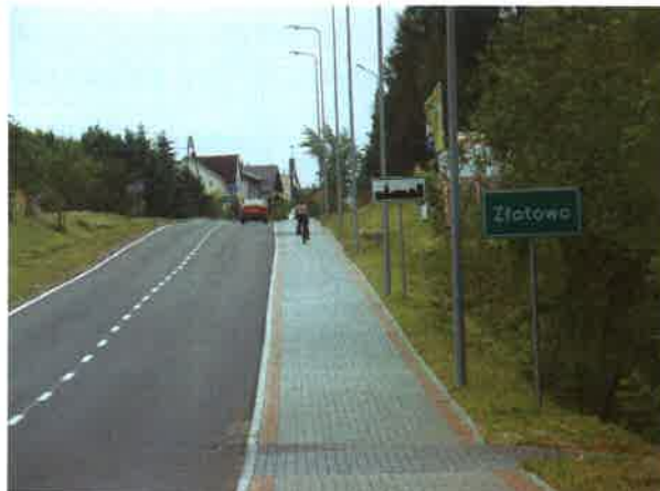
Wjazd do Złotowa od strony Malachina

Na terenie sołectwa nie ma żadnego obiektu użyteczności publicznej, takiej jak świetlica czy nawet czynna szkoła, która mogłaby służyć jako miejsce spotkań mieszkańców. Taki stan rzeczy wynika w dużym stopniu, iż wieś położona jest w bliskiej odległości od Czerska, w związku z czym zapewnia on zaspokojenie potrzeb mieszkańców, takie jak dostęp do urzędów, banków, ośrodków zdrowia, a także do kościoła. Charakterystyczną cechą tej wsi jest fakt, że nigdy nie zbudowano tu kościoła ani kaplicy. Przyczynami są zapewne wielkość wsi, niewielka ilość mieszkańców oraz bliskość Czerska. Z tego powodu Złotowo, jak i Łukowo od początku istnienia należą do parafii p.w. Św. Marii Magdaleny w Czersku.