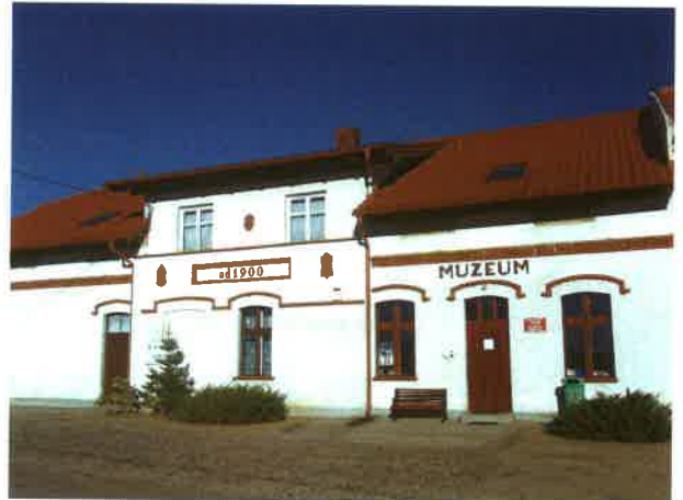
Muzeum w Odrach