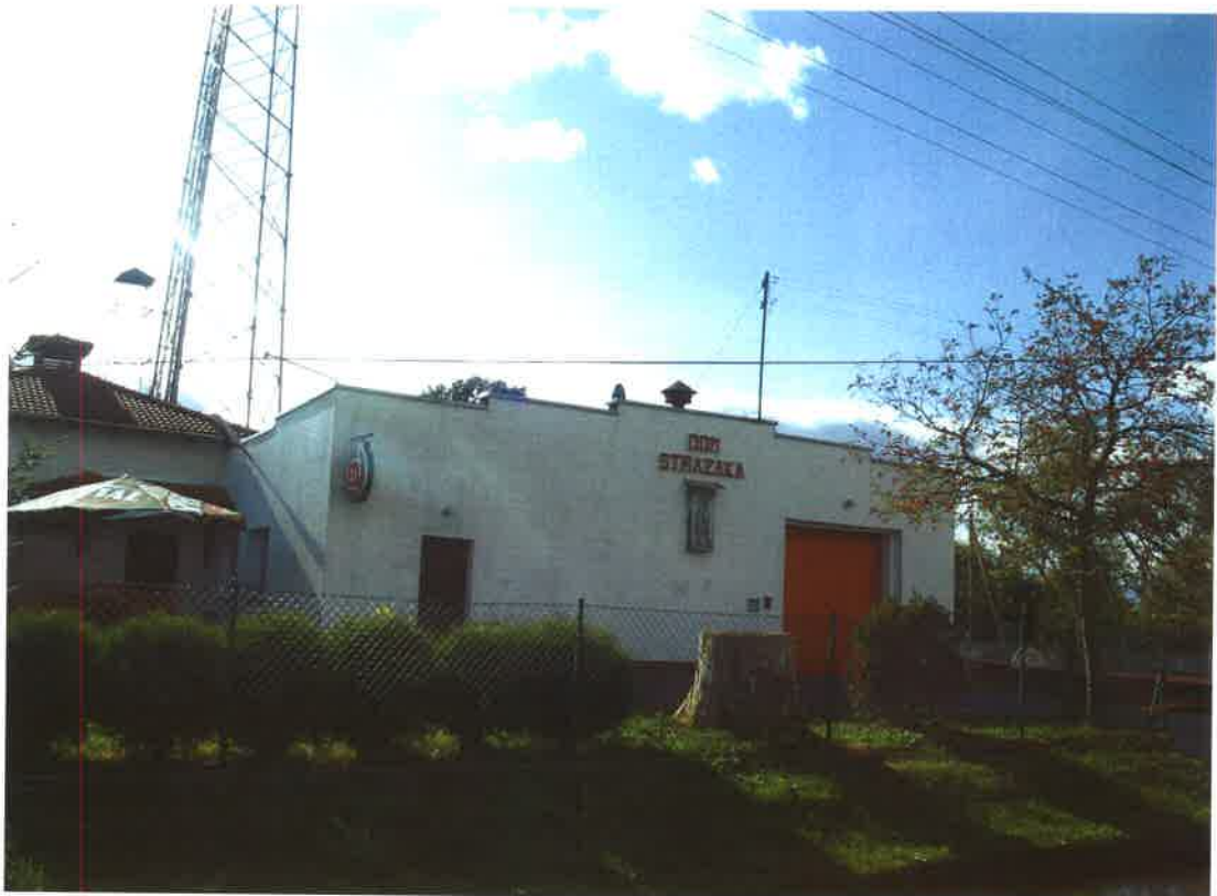
Remiza OSP w Odrach