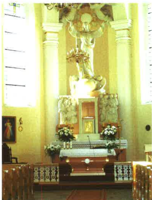
Ołtarz w Odrach

Z najpilniejszych prac niezbędne jest przebudowanie schodów do kościoła z uwzględnieniem likwidacji barier dla niepełnosprawnych oraz odwodnienie i zagospodarowanie terenu wokół kościoła.