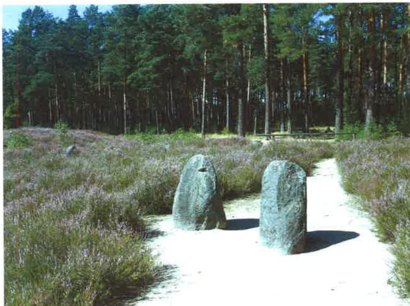
Rezerwat „ Kręgi Kamienne ” w Odrach

Rezerwat został utworzony w 1958 r., znajduje się na terenie Nadleśnictwa Czersk, Leśnictwa Odry w odległości 44km na północny wschód od Chojnic i 14 km na północ od Czerska. W bieżącym roku rezerwat obchodzi 50 rocznicę jego utworzenia. Rezerwat ten jest unikalnym obiektem. archeologicznym i przyrodniczym w skali europejskiej, którego obszar wynosi około 16,91 ha Wewnątrz obiektu pośród rzadkiego sosnowego lasu znajduje się 10 całych i 2 fragmenty kręgów kamiennych, z których najmniejszy posiada średnice 15 m, a największy 33 m, na obwodnicy kręgów ustawione są kamienie, wystające od 20 do 70 cm ponad powierzchnię ziemi. Oprócz kręgów znajduje się w rezerwacie ponad 20 kurhanów o średnicy od 8 do 12m i wysokości od 0,5 do 2 m. Oprócz kręgów na terenie rezerwatu znajdują się także kurhany. W kręgach i kurhanach odkryto ponad 600 grobów.