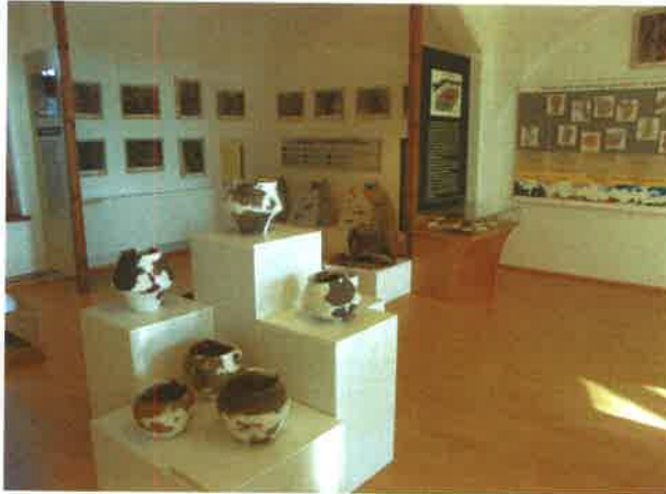
Ekspozycja archeologiczno – przyrodnicza