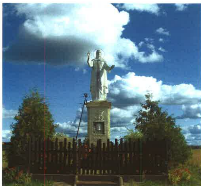
Figura Chrystusa Króla w Odrach