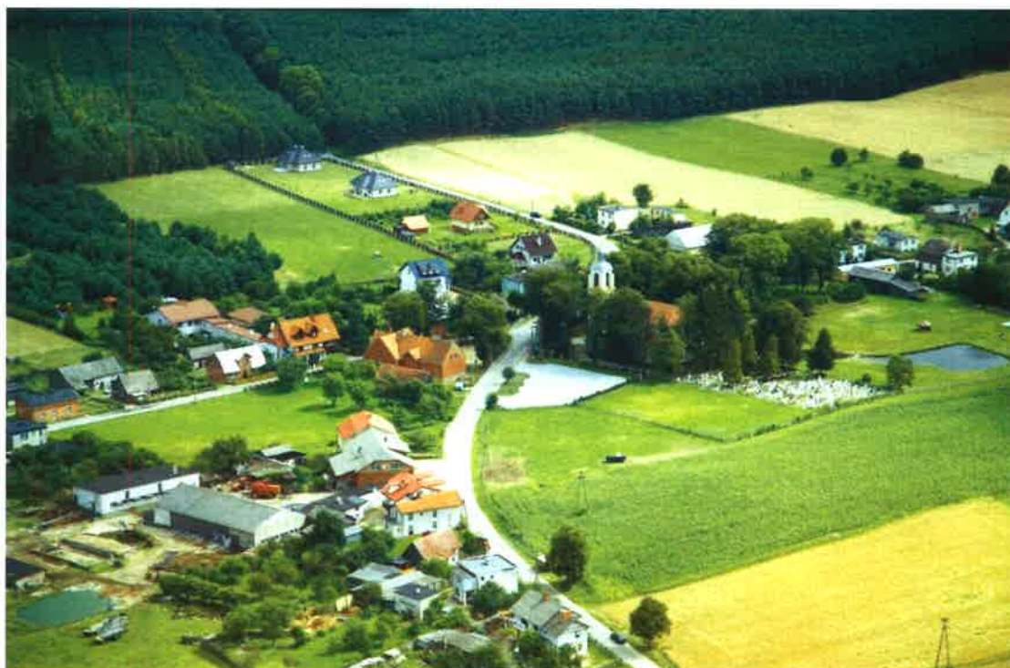
Odry z lotu ptaka.

Ścisłe centrum wsi stanowią zabudowanie kościelne (Kościół p. w. Wniebowzięcia Najświętszej Marii Panny z cmentarzem i obszernym placem parkingowym) oraz Szkoła Podstawowa prowadzona przez Stowarzyszenie na rzecz Szkoły w Odrach i Rozwoju Lokalnego. Znajdują się tu dwa sklepy, dwa bary, trzy przystanki PKS, figura sakralna Chrystusa Króla. W miejscowości Wojtał umiejscowiony jest przystanek kolejowy (z blaszaną wiatą) na linii Kościerzyna – Gdynia, obsługiwany przez PKP Przewozy Regionalne Sp. z o.o.