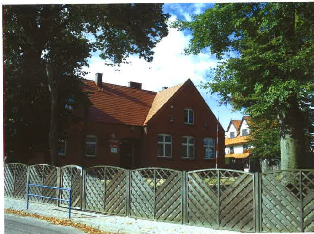
Szkoła Podstawowa w Odrach