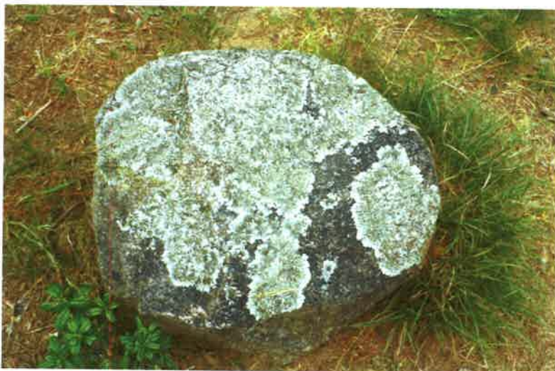
Porosty w rezerwacie w Odrach.

Występują tutaj cenne i unikatowe w skali Niżu Środkowoeuropejskiego porosty naskalne, które występowały we wczesnej epoce lodowcowej. Spośród 87 współcześnie żyjących tu gatunków, ponad 30 ma swoje centrum występowania w wysokich górach i jest to jedyne w Polsce stanowisko „chróścika kępkowego”. W Odrach znajduje się ponad 20 gatunków porostów umieszczonych na czerwonej liście gatunków zagrożonych wyginięciem. Uważa się za cud, że przetrwały w tak niekorzystnych dla siebie warunkach. Co więcej, porastają one całą powierzchnię głazów, a nie jedynie typową dla nich północną ich część. Fenomen ten, świadczący o mikroklimacie tego miejsca, jest nieustannie monitorowany przez naukowców. Rezerwat Kręgi Kamienne w Odrach są bowiem jedynym w Polsce rezerwatem porostów, z których niektóre występują tylko tutaj.