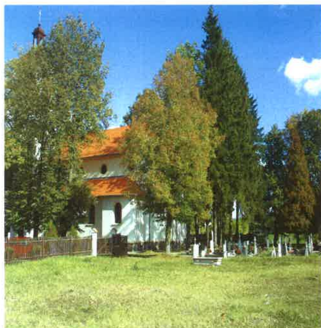
Kościół w Odrach