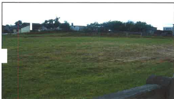
Boisko za Szkołą Podstawową w Odrach

Na terenie wsi soleckiej Odry znajduje się boisko, położone za budynkiem szkoły podstawowej. W zasadzie boisko stanowi naturalna i nierówna murawa, przypominająca kształtem prostokąt o nieregularnym kształcie. Boisko oraz cały teren je okalający, jak i dwie bramki na nim stojące, wymagają gruntownej renowacji. Brak jakiegokolwiek małej architektury.