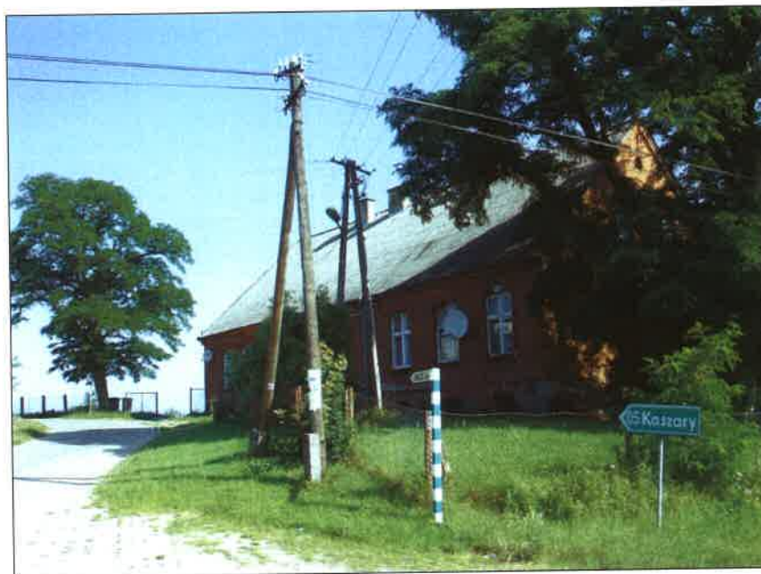
Fot.23 Wzgórze, na którym stoi Szkoła w Łubnej to historyczne miejsce w historii wsi

Jak wspomniano powyżej, poza szkoła nie ma na terenie sołectwa żadnego innego budynku pełniącego funkcje społeczną. Najbardziej dotkliwy dla mieszkańców jest brak jakiegokolwiek świetlicy wiejskiej lub innego miejsca spotkań. Uniemożliwia to organizowanie jakichkolwiek inicjatyw społecznych – spotkań, warsztatów, organizowania zajęć kół zainteresowań, uroczystości okazjonalnych typu Dzień Seniora, dzień Dziecka itd. Do tej pory wszystkie zebrania wiejskie odbywały się w niewielkiej szatni, w budynku szkoły. Pomieszczenie to może pomieścić zaledwie ok.12 osób. Wyklucza więc to pełnienie przez nie funkcji miejsca spotkań mieszkańców sołectwa. Brak miejsca spotkań mieszkańców jest jednym z największych problemów, z jakimi mieszkańcy sołectwa Łubna muszą zmagać się na co dzień. Nie tylko znacząco obniża on jakość życia mieszkańców, wpływając na nich zniechęcająco i wywołując marazm oraz bierność w przejawianiu jakichkolwiek inicjatyw oddolnych na rzecz lokalnej społeczności, ale wynika z niego także słaba integracja mieszkańców Łubnej.