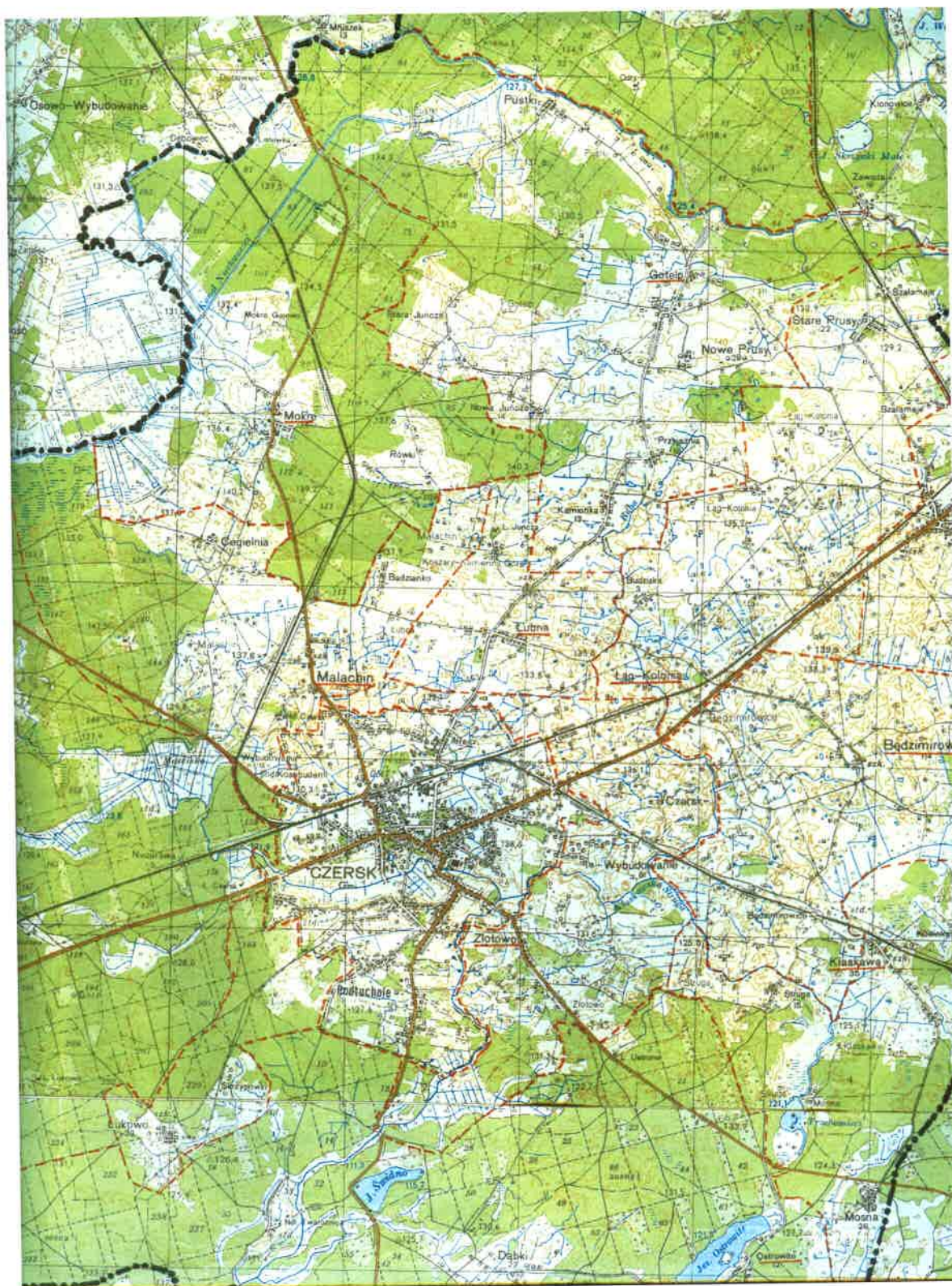
Mapa sołectwa Łubna

obrzeża wsi i sołectwa. Panuje tu dość urozmaicona rzeźba terenu, w pobliżu wsi zachowały się m.in. obniżenia wytopiskowe o nieregularnych kształtach. Nazwa wsi – „Łubna” - ma charakter fizjograficzny; istnieje ona od XVI w. początkowo jako „Liubnia”.