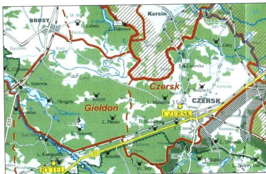
Rys.3 Sołectwo Łubna na tle podziału administracyjnego Nadleśnictwa Czersk

Według regionalizacji przyrodniczo-leśnej (Trampler T. i inni, 1990) tereny Sołectwa należą do Krainy III Wielkopolsko-Pomorskiej, dzielnicy Borów Tucholskich, mezoregionu Borów Tucholskich. Dla krainy tej charakterystyczne są siedliska borowe, z dominującym udziałem sosny (90%,) oraz niewielką domieszką świerka i gatunków liściastych – buka, dębu, olszy, brzozy. Należy jednak podkreślić, iż tereny sołectwa Łubna mają w większości charakter bezleśny.