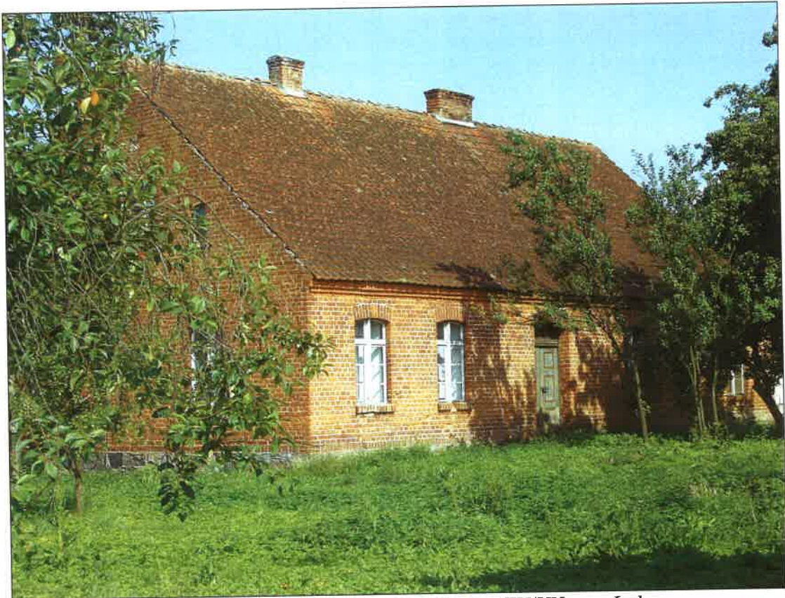
Fot. 17 Budynek mieszkalny z przełomu XIX/XX w. – Łubna