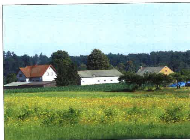
Zdjęcie nr 1. Typowy krajobraz rolniczy sołectwa Łubna

W pewnym oddaleniu od drogi powiatowej, w odległości ok.0,5 km od centrum Łubnej mieści się nieduża osada Koszary – wieś o bardzo zwartej zabudowie, położona wśród pól, łąk i lasów. Prowadzi do niej gruntowa, polna droga. Układ wsi na planie „krzyża”, na skrzyżowaniu dróg stara kapliczka. Za wsią – siedziba leśnictwa Juńcza.