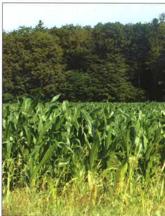
Fot.13/14 - Tereny sołectwa Łubna – ściana lasu wyznacza granicę rolniczego sołectwa Łubna z sąsiednim sołectwem Malachin