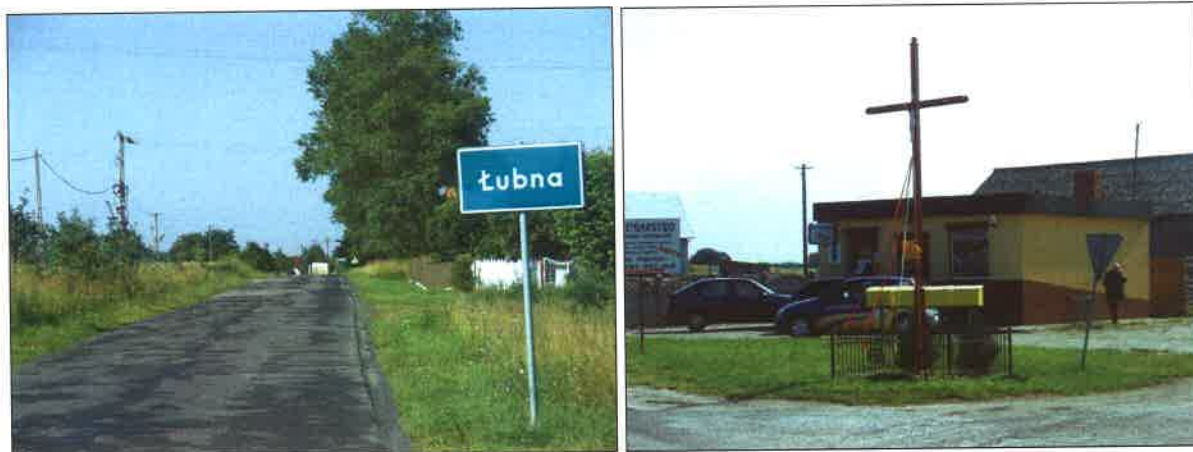
Fot. 3/4 – Wjazd do Łubnej oraz centrum wsi

Wzdłuż drogi, przebiegającej przez środek wsi i stanowiącej jednocześnie główną ulicę miejscowości, rosną stare drzewa, jak i nowe nasadzenia m.in. dębów. Przy głównej drodze mieszczą się wszystkie najważniejsze budynki użyteczności publicznej (tj. szkoła podstawowa) oraz usługowe wsi: sklepy spożywczo-przemysłowe. Ponadto mieszczą się tu także przystanki PKS – zadaszone wiaty, ustawione po obu stronach drogi.