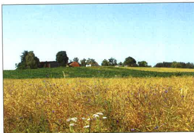
Zdjęcie nr 2. Na terenie sołectwa przeważają łąki i pola

W pewnym oddaleniu od drogi powiatowej, w odległości ok.0,5 km od centrum Łubnej mieści się nieduża osada Koszary – wieś o bardzo zwartej zabudowie, położona wśród pól, łąk i lasów. Prowadzi do niej gruntowa, polna droga. Układ wsi na planie „krzyża”, na skrzyżowaniu dróg stara kapliczka. Za wsią – siedziba leśnictwa Juńcza.