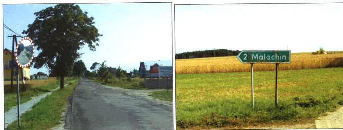
Fot. 5/6 – Łubna na wysokości skrzyżowania z drogą na Malachin

Wzdłuż drogi, przebiegającej przez środek wsi i stanowiącej jednocześnie główną ulicę miejscowości, rosną stare drzewa, jak i nowe nasadzenia m.in. dębów. Przy głównej drodze mieszczą się wszystkie najważniejsze budynki użyteczności publicznej (tj. szkoła podstawowa) oraz usługowe wsi: sklepy spożywczo-przemysłowe. Ponadto mieszczą się tu także przystanki PKS – zadaszone wiaty, ustawione po obu stronach drogi.