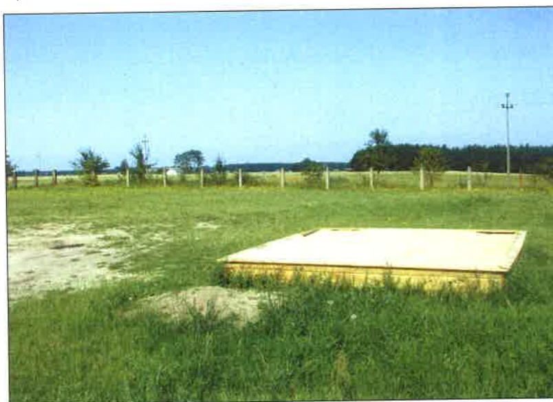
Fot. 22 Niezagospodarowany plac przed szkołą podstawową w Łubnej

– na bierne spędzanie wolnego czasu. Tym samym młodzież z Łubnej ma nierówne szanse w codziennym rozwoju fizycznym, a także społecznym. Młodzież podjęła by bowiem chętnie działanie i okazuje aktywność, ale w związku z brakiem odpowiedniej bazy – ich wysiłki napotykają na przeszkody nie do pokonania. Ponadto brak odpowiedniej bazy, terenów i obiektów powoduje także niską jakość życia mieszkańców Łubnej oraz niską atrakcyjność osiedleńczą tych terenów. W Łubnej, tuż przy miejscowej szkole znajduje się obszerny plac, który można by zagospodarować pod kątem rekreacyjnym. Do tej pory plac ten pozostaje pusty i zaniedbany, wysoce nieestetyczny, mimo doskonałej lokalizacji.