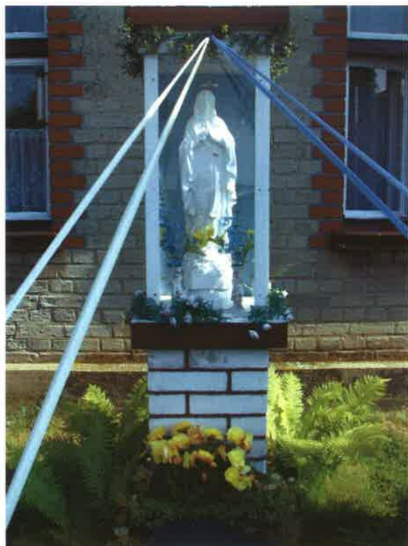
Fot. 15 Kapliczka w Łubnej

Jedynie obiekty historyczne zachowane na terenie sołectwa Czersk to kilka starych kapliczek przydrożnych w Łubnej oraz Koszarach. Najstarsza, murowana kapliczka – z 1920 r. zachowała się w Koszarach. Otoczona jest kilkudziesięcioletnimi nasadzeniami żywotników.