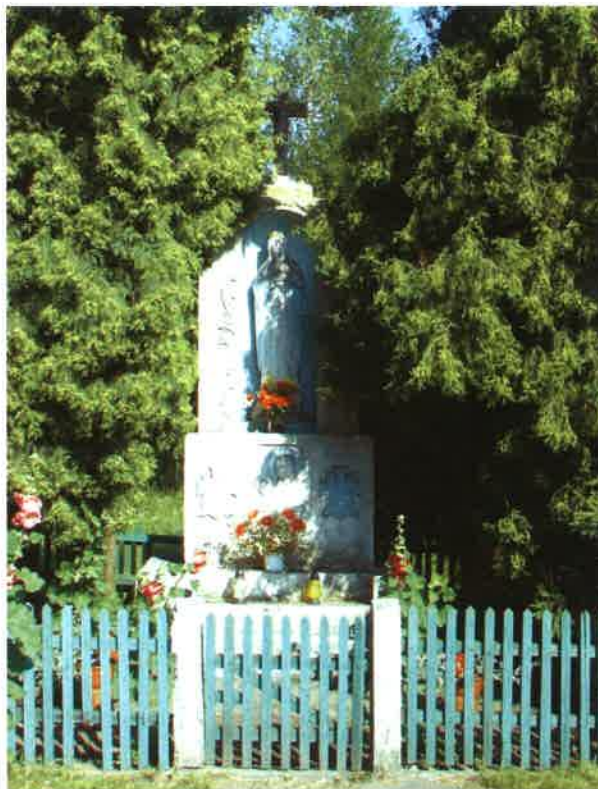
Fot.16 Kapliczka w Koszarach

Kolejne kapliczki znajdują się w Łubnej – przy głównej drodze, przy Przedsiębiorstwie „DREWIN” oraz na terenie prywatnym – za stawem oraz w kierunku Malachin.