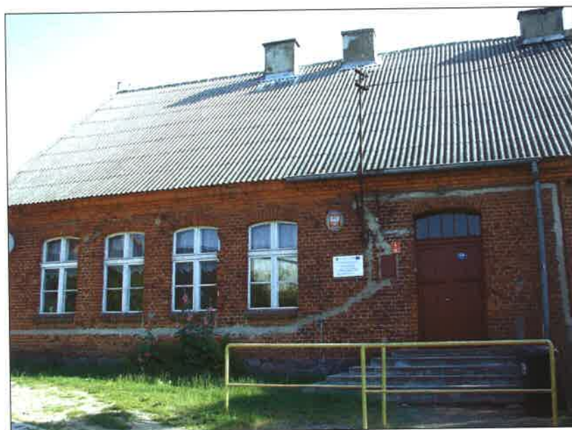
Fot.18 – szkoła podstawowa w Łubnej

Do najlepiej zachowanych, historycznych budynków sołectwa Łubna należy miejscowa szkoła. Powstała ona w II połowie XX w. Zbudowana jest na obrzeżach wsi, na lekkim wzniesieniu.