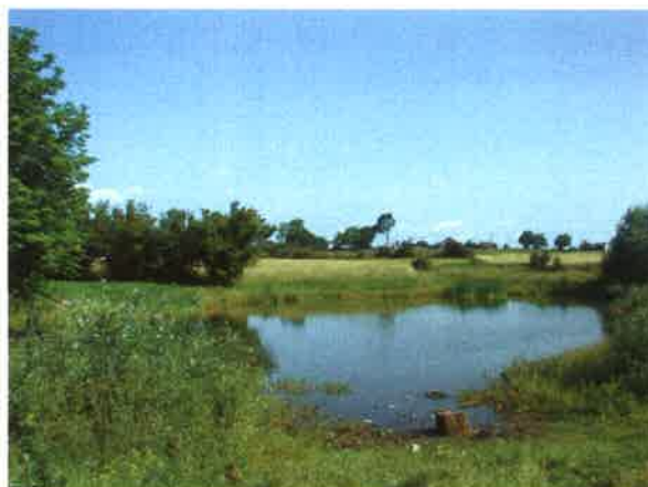
Fot. 7/8 – Łubna – nad „stawkiem”

Pośrodku wsi znajduje się skrzyżowanie dróg – jadąc od strony Czerska gruntowa droga w lewo prowadzi – pasem łąk, pastwisk i pól - na Malachin. Natomiast droga odbijająca w prawo to wewnętrzna droga Łubnej, wzdłuż której mieści się zwarta zabudowa domów i gospodarstw rolnych. Nad drogą położony jest także niewielki staw oraz stary budynek remizy OSP z lat 40-tych XX w. W centrum wsi – tuż obok sklepu spożywczego oraz skrzyżowania dróg na Malachin – Odry – Łubna stoi drewniany krzyż.