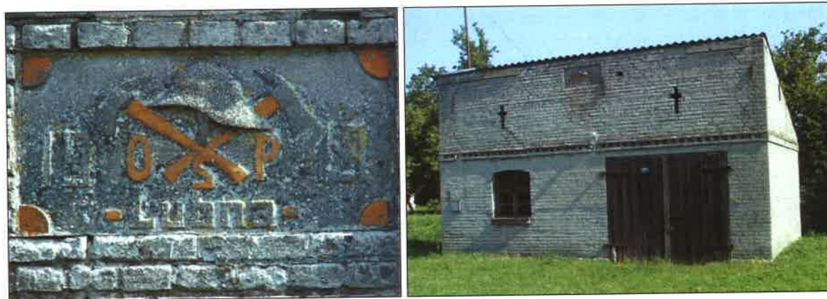
Fot.19/20 – sygnaturka oraz budynek powojennej remizy OSP w Łubnej

W Łubnej zachowała się także stara, murowana remiza OSP – znajduje się ona „za stawkiem”, na terenie prywatnej posesji.