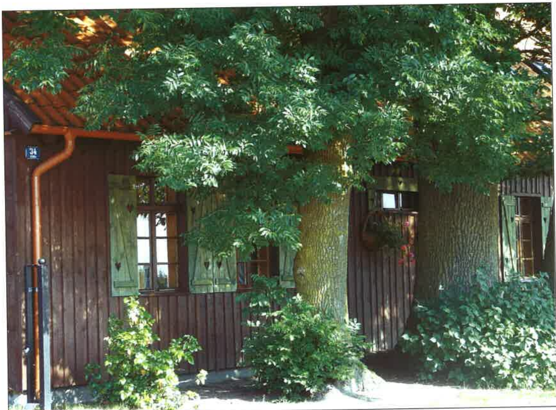
Fot. 18 – Zabytkowy, odrestaurowany dom p.Czapiewskich w Łubnej