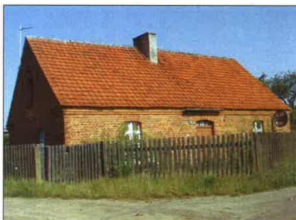
Fot. 9/10 – Koszary; zabudowa wsi oraz historyczny budynek mieszkalny