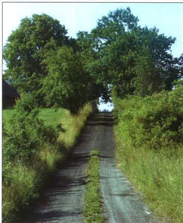
Fot.11/12 - Tereny sołectwa Łubna – przeważają tereny bezleśne, nasadzenia są z reguły punktowe, wzdłuż dróg