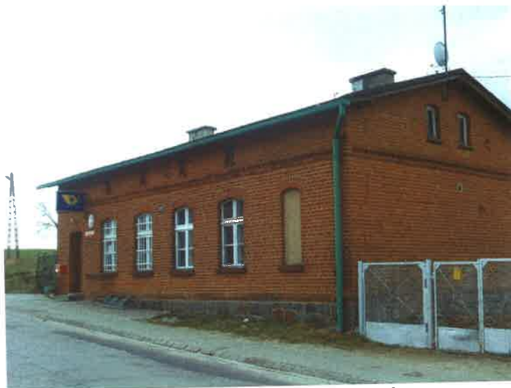
Filia czerskiego oddziału poczty w Gotelpiu

wykonany z cegły, jest własnością Poczty Polskiej S.A i wykorzystywany jest przez filię poczty w Czersku w połowie swojej powierzchni. Filia czerskiego oddziału poczty, który oferuje usługi pocztowe i finansowe, istnieje od maja 2009 r., wcześniej mieścił się tu samodzielny oddział poczty w Gotelpiu. Pozostała powierzchnia tego budynku wynajmowana jest prywatnej osobie na cele mieszkaniowe.