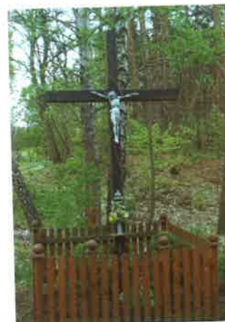
Krzyż przydrożny w Gotelciu