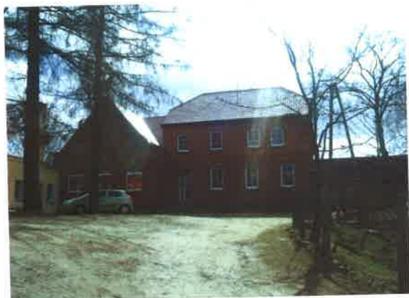
Szkola podstawowa w Gotelciu część zbud. w 1887 r.

trwałym materiałem typu polbruk. Budynki szkoły podstawowej zostały poddane termomodernizacji w wyniku realizacji projektu „Poprawa jakości powietrza w gminie Czersk poprzez termomodernizację budynków użyteczności publicznej” w ramach tzw. Mechanizmu Finansowego EOG w obszarze priorytetu 2.1 – Ochrona środowiska, w tym środowiska ludzkiego.