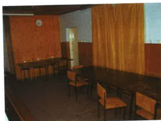
Część przedsionka świetlicy