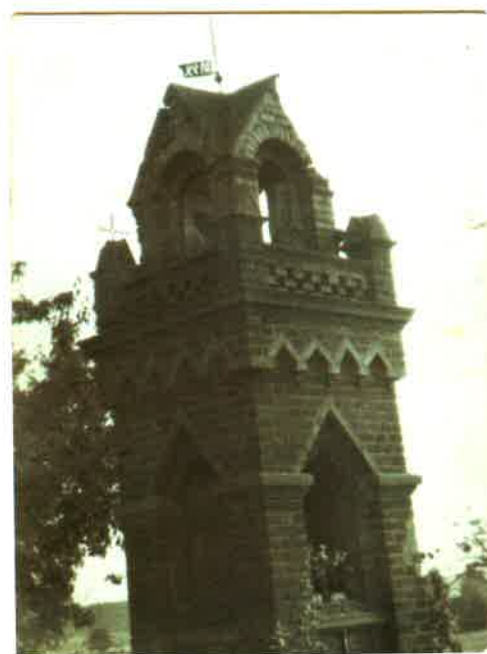
Kapliczka przed laty

Wieś Gotelc ma kilka ciekawych budynków w swoim obrębie. Takim jest z pewnością budynek poczty w Gotelciu, który wg mieszkańców został zbudowany w 1911 r. Obiekt,