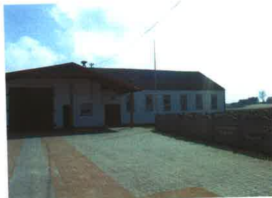
Świetlica wiejska z OSP w Gotelciu stan na dziś