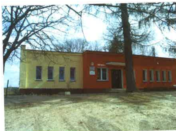
oraz część zbud. w 1965 r.

Ważnym miejscem Gotelpia jest świetlica wiejska zlokalizowana razem z siedzibą OSP w jednym budynku. Budynek znajduje się przy głównej ulicy wsi, prowadzi do niego obszerny podjazd z kostki brukowej. Teren przyległy do remizy ogrodzony jest płotem z metalowej siatki i z płyt betonowych, który wymaga konserwacji i remontu.