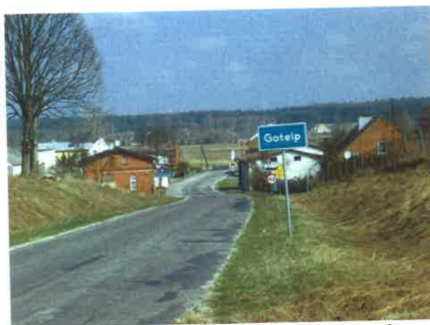
Widok na wjazd do Gotelpia od strony Czerska

Wieś sołectwa Gotelc jest miejscowością bezładnie rozrzuconą, która nie tworzy zwartego skupiska domostw. Największe zagęszczenie zabudowań rozpościera się wzdłuż głównej drogi prowadzącej z Odrów do Czerska. Przy tej drodze usytuowane są również sklepy, poczta, dwa przystanki autobusowe, OSP ze świetlicą wiejską oraz szkoła. Wieś nie ma konkretnych ulic o własnych nazwach oraz ściśle wyodrębnionego centrum.