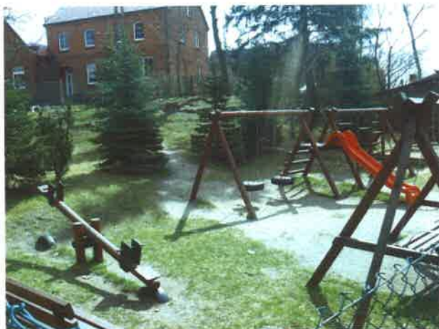
Plac zabaw przed szkołą podstawową w Gotelciu

Przed szkołą znajduje się plac zabaw, jedyne miejsce, gdzie miejscowe dzieci mogą spędzać wolny czas. Plac zabaw znajduje się tuż przy drodze Czersk – Odrzy, więc dzieci muszą być pod nieustanną opieką osób dorosłych.