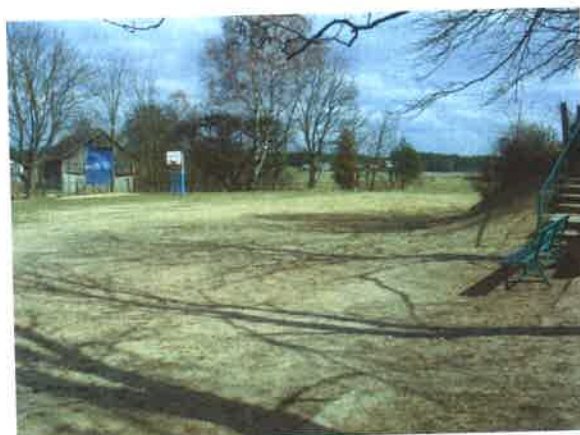
Boisko przyszkolne w Gotelciu

Na terenie wsi sołeckiej Gotelc znajduje się boisko, położone obok budynku szkoły podstawowej. Boisko stanowi plac przypominający kształtem prostokąt o nieregularnym kształcie, a w rzeczywistości jest to wydeptany kawałek ziemi, na obrzeżach porośnięty trawą. Teren boiska, bramki oraz stałe konstrukcje do piłki koszykowej na nim stojące, wymagają gruntownej renowacji. Brak jakiegokolwiek małej architektury.