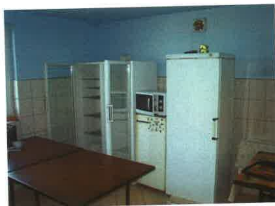
Wyposażenie kuchni w świetlicy