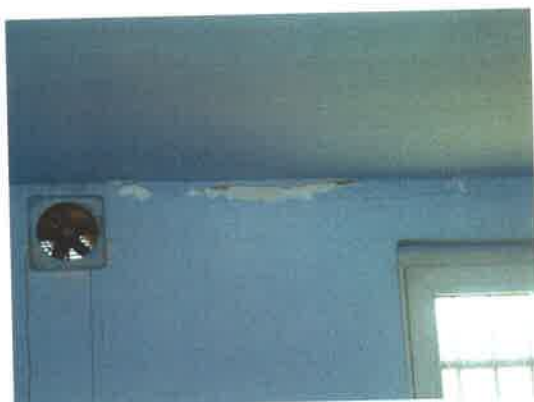
Fragment ścian kuchni w świetlicy