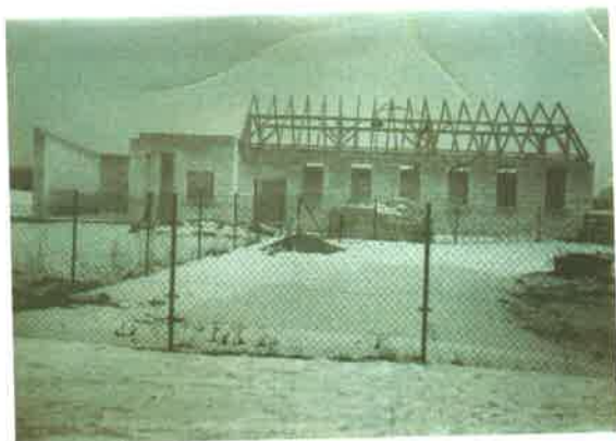
Świetlica wiejska z OSP w Gotelciu w trakcie bud. w 1982r.