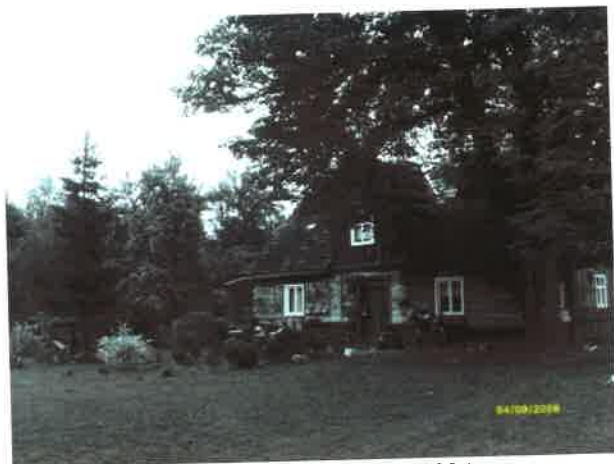
Drewniany dom zbud. w 1934 r.

turyści wracający z Rezerwatu archeologiczno – przyrodniczego Kręgi Kamienne w Odrach. Swoistym drogowskazem, pokazującym kierunek dojazdu do powyższego budynku jest przydrożny krzyż, który postawiono tu w 1981 r. w stanie wojennym z inicjatywy właścicieli domu. Figura Jezusa Chrystusa, która zdobi krzyż, jest od niego wiele starsza, przedwojenna.