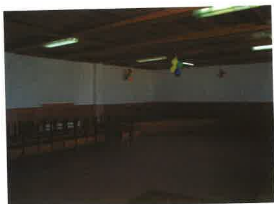
Sala widowiskowa świetlicy wiejskiej w Gotelciu