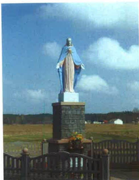
Figura Jezusa Chrystusa w Gotelciu

Kapliczka znajduje się na prywatnej posesji jednego z mieszkańców wsi. Możliwe, że jest najstarszym obiektem w całej wsi, ponieważ zbudowano ją w 1899 r. Przez lata była chroniona przed zniszczeniem i konserwowana przez kolejne pokolenia właścicieli posesji Gotelc 45.