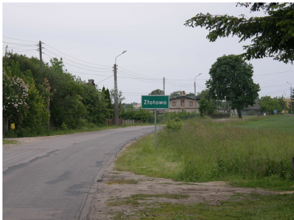
Wjazd do Złotowa od strony Łubnej