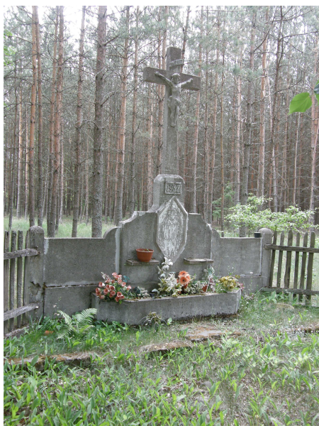
Krzyż w Łukowie