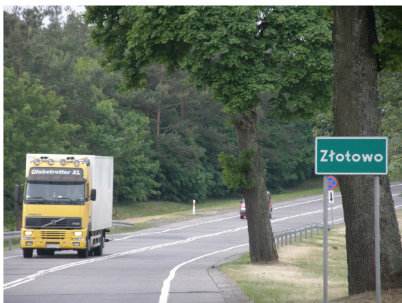
Wjazd do Złotowa od strony Łęga

Układ przestrzenny wsi można określić jako nietypowy, rozwlekły. Złotowo położone jest wokół Czerska i stanowi niepełny pierścień opasujący to miasto. Na terenie miejscowości wyróżnić można kilka ulic takich jak Bukowa, Gajowa, Klaskawska, Śliwicka, Złotowska oraz następujące tereny Wybudowanie pod Łąg, Wybudowanie pod Łubną, Wybudowanie pod Łukowo, Wybudowanie pod Malachin, Wybudowanie pod Strugę oraz Wybudowanie pod Tucholę. Z powodu wyjątkowego charakteru, czyli położenia względem Czerska, nie sposób określić centrum Złotowa. Tereny sołectwa w dużej mierze stanowią gospodarstwa oraz w pewnej części las.