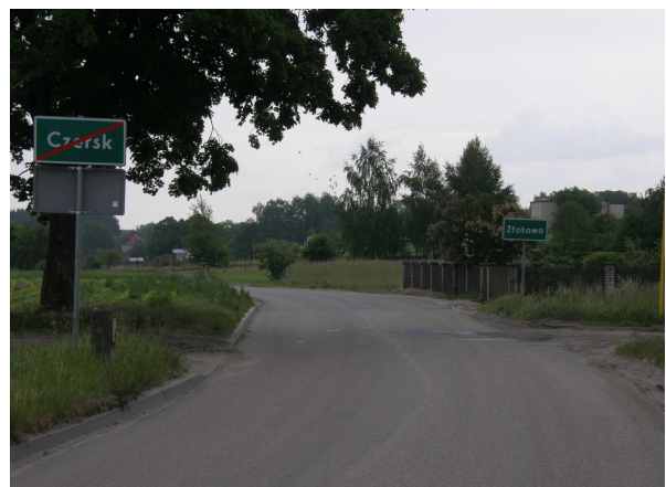
Wyjazd z Czerska do Złotowa od strony Klaskawy