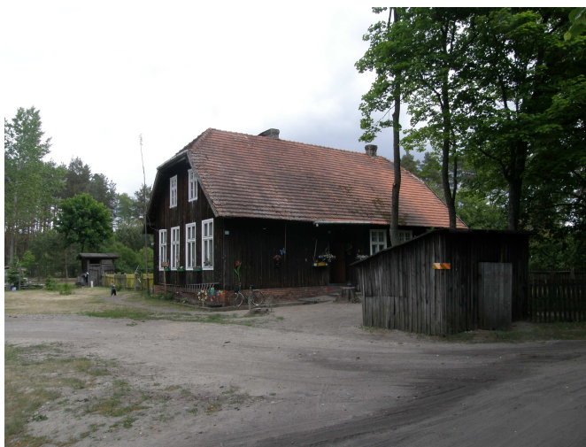
Budynek dawnej szkoły w Łukowie