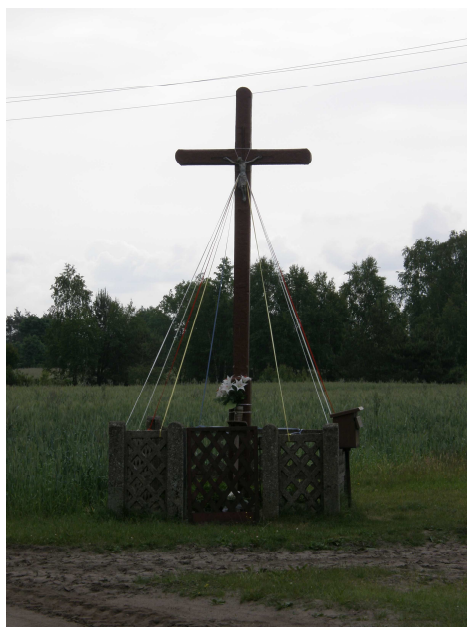
Krzyż w Złotowie