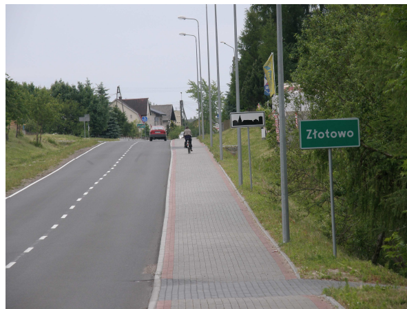
Wjazd do Złotowa od strony Malachina

Na terenie sołectwa nie ma żadnego obiektu użyteczności publicznej, takiej jak świetlica czy nawet czynna szkoła, która mogłaby służyć jako miejsce spotkań mieszkańców. Taki stan rzeczy wynika w dużym stopniu, iż wieś położona jest w bliskiej odległości od Czerska, w związku z czym zapewnia on zaspokojenie potrzeb mieszkańców, takie jak dostęp do urzędów, banków, ośrodków zdrowia, a także do kościoła. Charakterystyczną cechą tej wsi jest fakt, że nigdy nie zbudowano tu kościoła ani kaplicy. Przyczynami są zapewne wielkość wsi, niewielka ilość mieszkańców oraz bliskość Czerska. Z tego powodu Złotowo, jak i Łukowo od początku istnienia należą do parafii p.w. Św. Marii Magdaleny w Czersku.