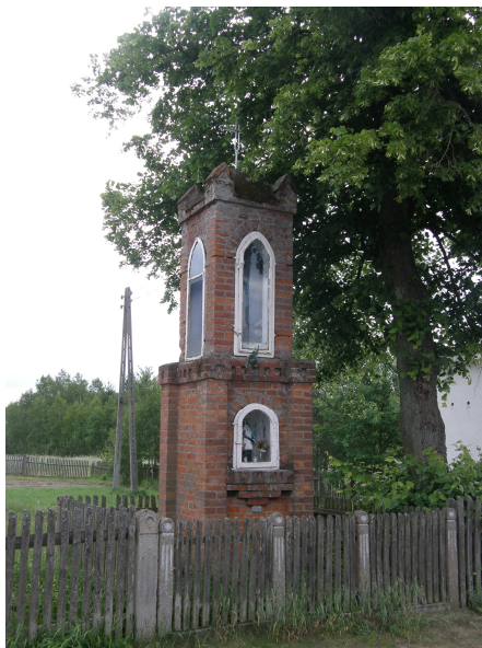
Kapliczka w Łukowie