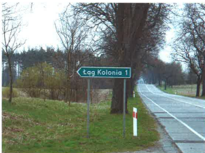
Zjazd w kierunku Łąga Kolonii z drogi krajowej nr 22