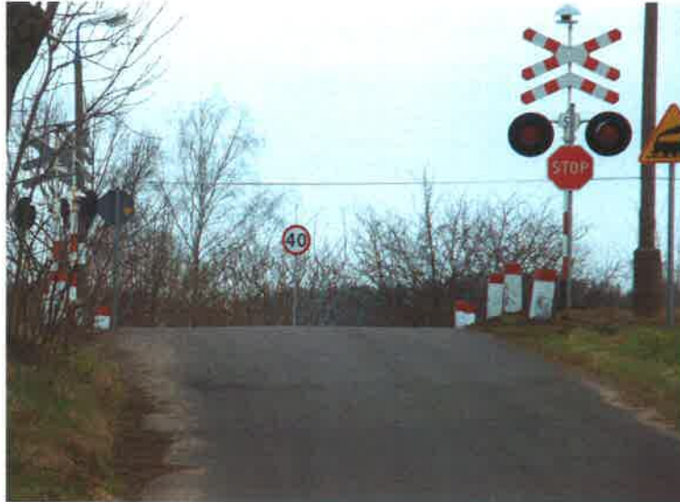
Jeden z przejazdów kolejowych na terenie sołectwa

Układ przestrzenny wsi charakteryzuje zabudowa rozproszona, bez wyodrębnionych ulic o nazwach własnych. Szkielet kompozycyjny układu zabudowy stanowi sieć dróg w większości gruntowych, okalających pola wraz z zabudowaniami.