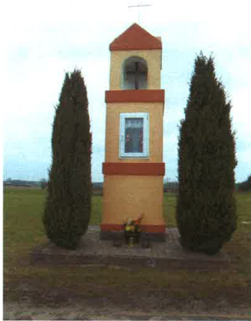
Kapliczka w Łęgu Kolonia