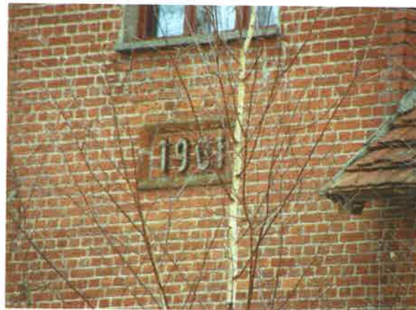
Świetlica w budynku dawnej szkoły