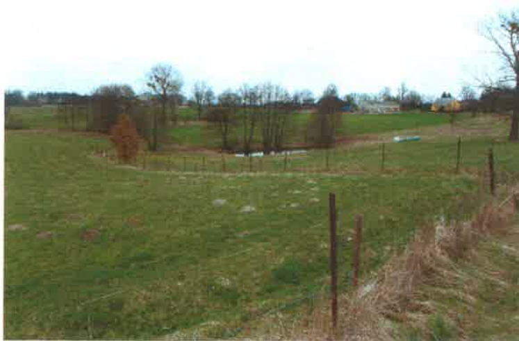
Charakterystyczne ukształtowanie terenu

Tereny, na których wieś jest położona mają charakter pagórkowaty i są szczególnie bogate w gatunki takie jak żurawie, dziki, lisy oraz bobry.