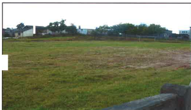
Boisko za Szkołą Podstawową w Odrach

Na terenie wsi sołeckiej Odry znajduje się boisko, położone za budynkiem szkoły podstawowej. W zasadzie boisko stanowi naturalna i nierówna murawa, przypominająca kształtem prostokąt o nieregularnym kształcie. Boisko oraz cały teren je okalający, jak i dwie bramki na nim stojące, wymagają gruntownej renowacji. Brak jakiegokolwiek małej architektury.