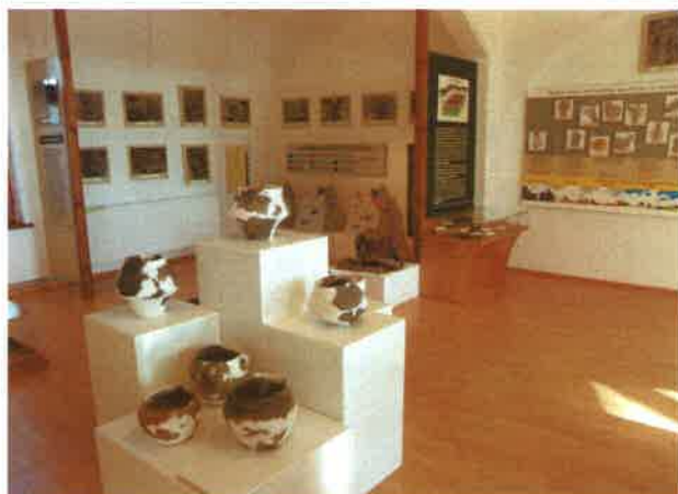
Ekspozycja archeologiczno – przyrodnicza