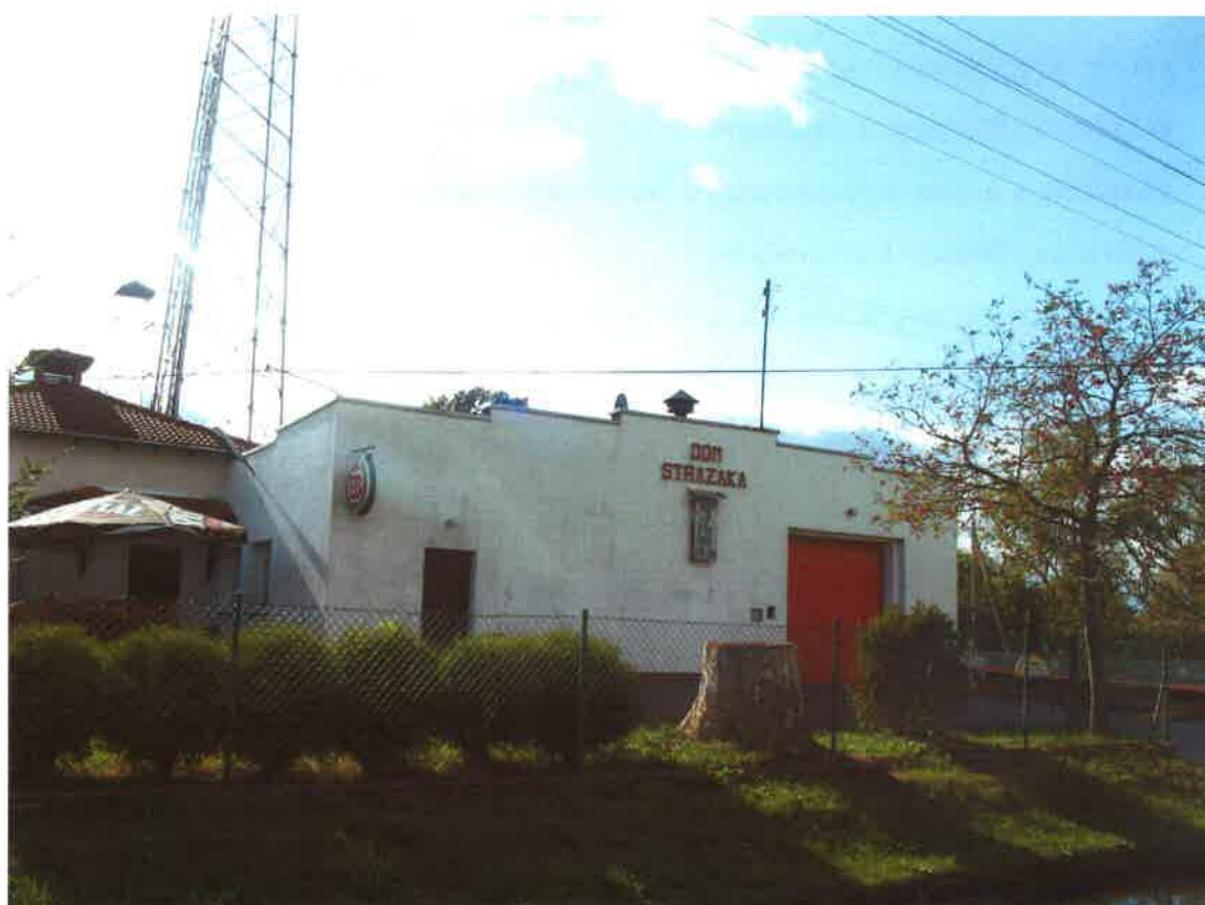
Remiza OSP w Odrach