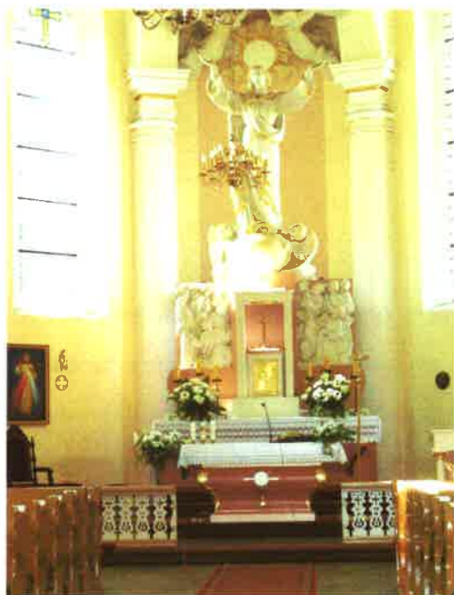
Ołtarz w Odrach

Z najpilniejszych prac niezbędne jest przebudowanie schodów do kościoła z uwzględnieniem likwidacji barier dla niepełnosprawnych oraz odwodnienie i zagospodarowanie terenu wokół kościoła.