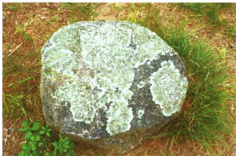
Porosty w rezerwacie w Odrach.

Występują tutaj cenne i unikatowe w skali Niziny Środkowoeuropejskiej porosty naskalne, które występowały we wczesnej epoce lodowcowej. Spośród 87 współcześnie żyjących tu gatunków, ponad 30 ma swoje centrum występowania w wysokich górach i jest to jedyne w Polsce stanowisko „chróścika kępkowego”. W Odrach znajduje się ponad 20 gatunków porostów umieszczonych na czerwonej liście gatunków zagrożonych wyginięciem. Uważa się za cud, że przetrwały w tak niekorzystnych dla siebie warunkach. Co więcej, porastają one całą powierzchnię głazów, a nie jedynie typową dla nich północną ich część. Fenomen ten, świadczący o mikroklimacie tego miejsca, jest nieustannie monitorowany przez naukowców. Rezerwat Kręgi Kamienne w Odrach są bowiem jedynym w Polsce rezerwatem porostów, z których niektóre występują tylko tutaj.