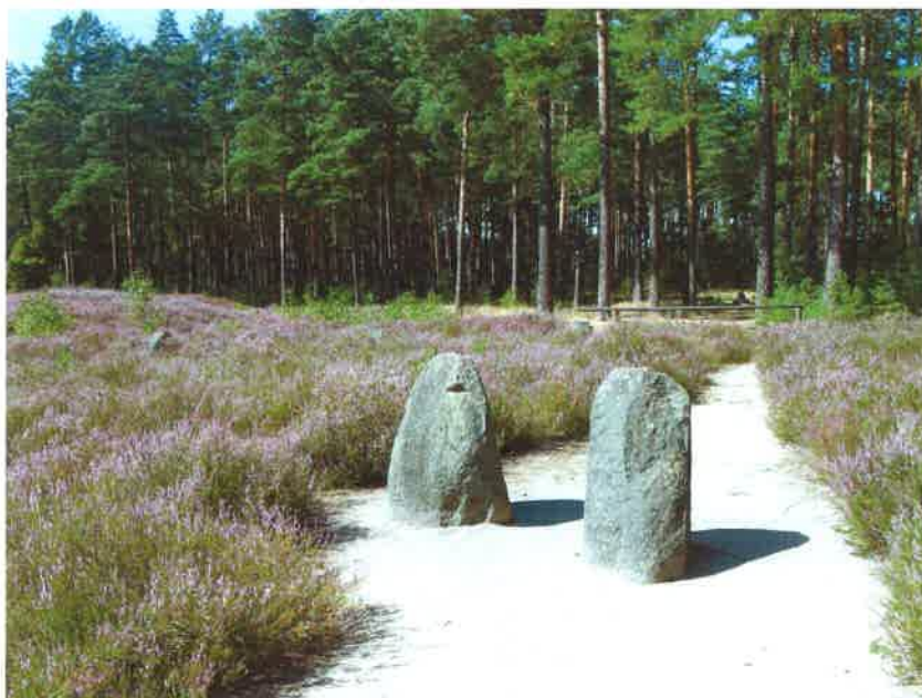
Rezerwat „ Kręgi Kamienne” w Odrach

Rezerwat został utworzony w 1958 r., znajduje się na terenie Nadleśnictwa Czersk, Leśnictwa Odry w odległości 44km na północny wschód od Chojnic i 14 km na północ od Czerska. W bieżącym roku rezerwat obchodzi 50 rocznicę jego utworzenia. Rezerwat ten jest unikalnym obiektem. archeologicznym i przyrodniczym w skali europejskiej, którego obszar wynosi około 16,91 ha Wewnątrz obiektu pośród rzadkiego sosnowego lasu znajduje się 10 całych i 2 fragmenty kręgów kamiennych, z których najmniejszy posiada średnicę 15 m, a największy 33 m, na obwodnicy kręgów ustawione są kamienie, wystające od 20 do 70 cm ponad powierzchnię ziemi. Oprócz kręgów znajduje się w rezerwacie ponad 20 kurhanów o średnicy od 8 do 12m i wysokości od 0,5 do 2 m. Oprócz kręgów na terenie rezerwatu znajdują się także kurhany. W kręgach i kurhanach odkryto ponad 600 grobów.