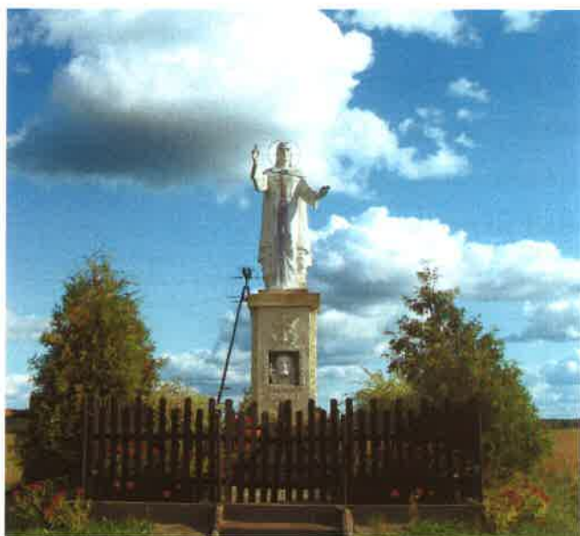
Figura Chrystusa Króla w Odrach