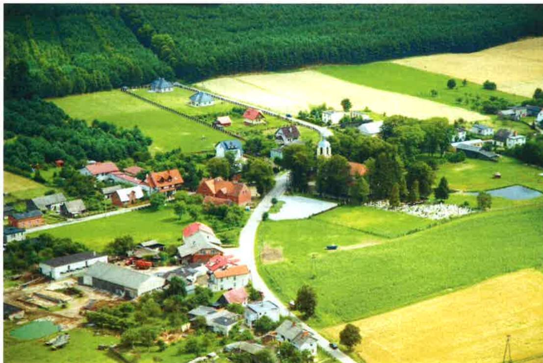
Odry z lotu ptaka.

Ścisłe centrum wsi stanowią zabudowanie kościelne (Kościół p. w. Wniebowzięcia Najświętszej Marii Panny z cmentarzem i obszernym placem parkingowym) oraz Szkoła Podstawowa prowadzona przez Stowarzyszenie na rzecz Szkoły w Odrach i Rozwoju Lokalnego. Znajdują się tu dwa sklepy, dwa bary, trzy przystanki PKS, figura sakralna Chrystusa Króla. W miejscowości Wojtał umiejscowiony jest przystanek kolejowy (z blaszaną wiatą) na linii Kościerzyna – Gdynia, obsługiwany przez PKP Przewozy Regionalne Sp. z o.o.