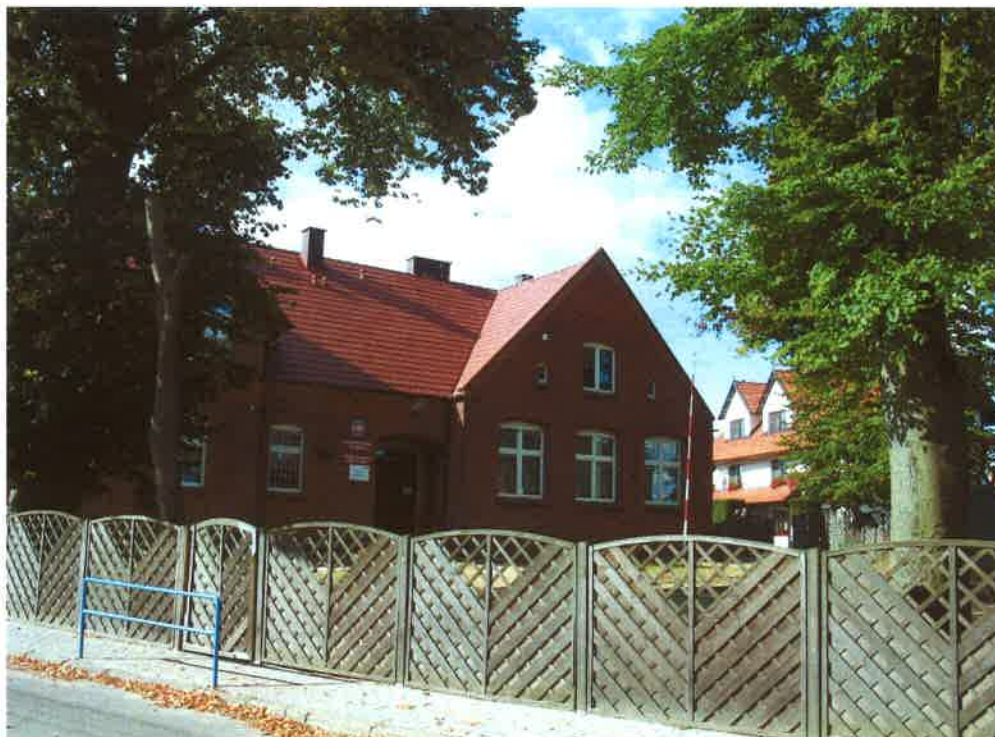
Szkoła Podstawowa w Odrach