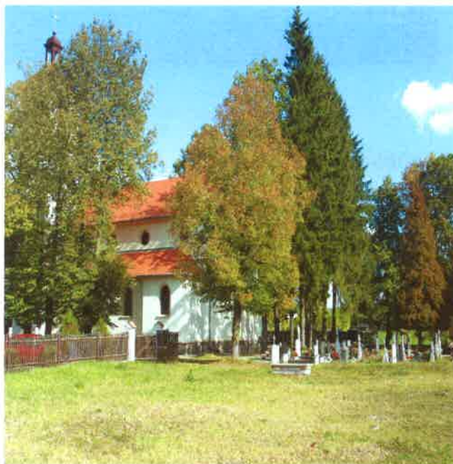
Kościół w Odrach p.w. Najświętszej Marii Panny