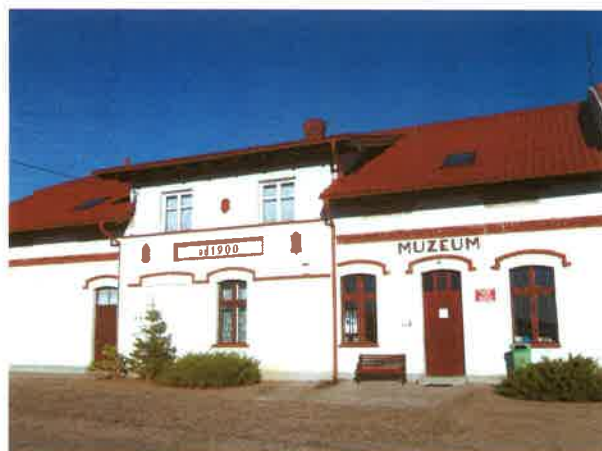
Muzeum w Odrach